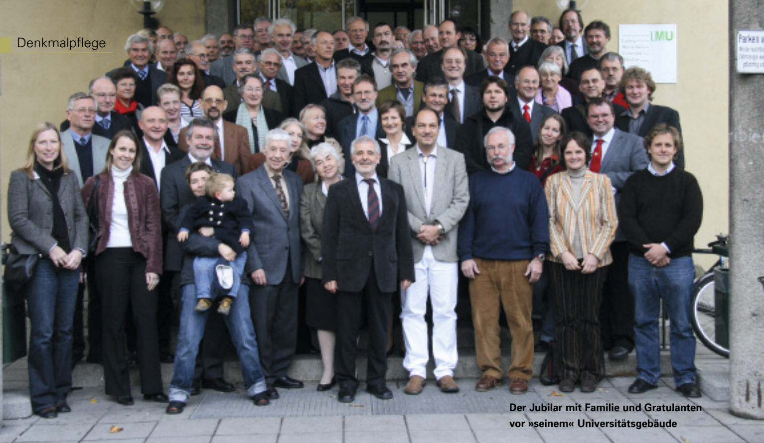
Der Jubilar mit Familie und Gratulanten vor »seinem« Universitätsgebäude