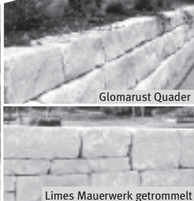
Limes Mauerwerk getrommelt