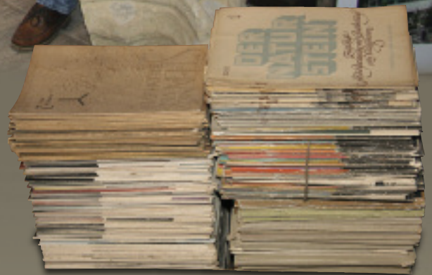
Steinmetz-Fachliteratur in Hülle und Fülle

Seit fünf Generationen arbeitet die Steinmetzfamilie Scherer in Ulm und um Ulm herum. Anlässlich des 140-jährigen Bestehens ihres Betriebs hat sie auf dem Firmengelände ein sehenswertes Steinmetz-Museum eröffnet.