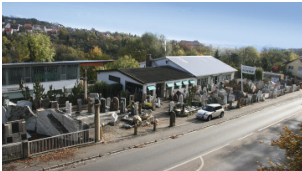
140 Jahre alt und quicklebendig: der Steinmetzbetrieb Scherer am Ulmer Hauptfriedhof