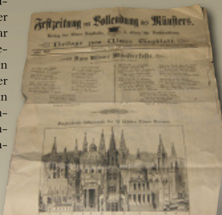
Links: Festzeitung zur Fertigstellung des Ulmer Münsters

Zum Tätigkeitsfeld des Unternehmens gehören aber auch Restaurierungen sowie die Fertigung von Skulpturen und Brunnen. So hat die Firma u. a. an der Sanierung der Klosterkirche Wiblingen, der Bundesfestung Ulm, des Ulmer Rathauses, der Georgskirche und dem Hauptsitz der Ulmer Volksbank mitgewirkt.