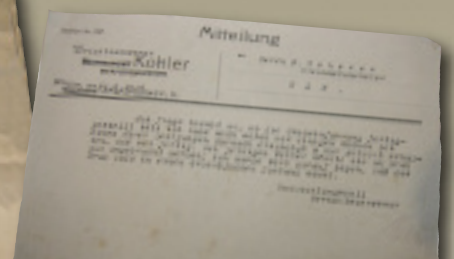
Unten: Mitteilung von 1918 – manches ändert sich nie ...