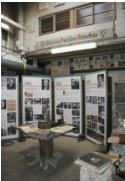
Die Firmentradition ist gut dokumentiert.