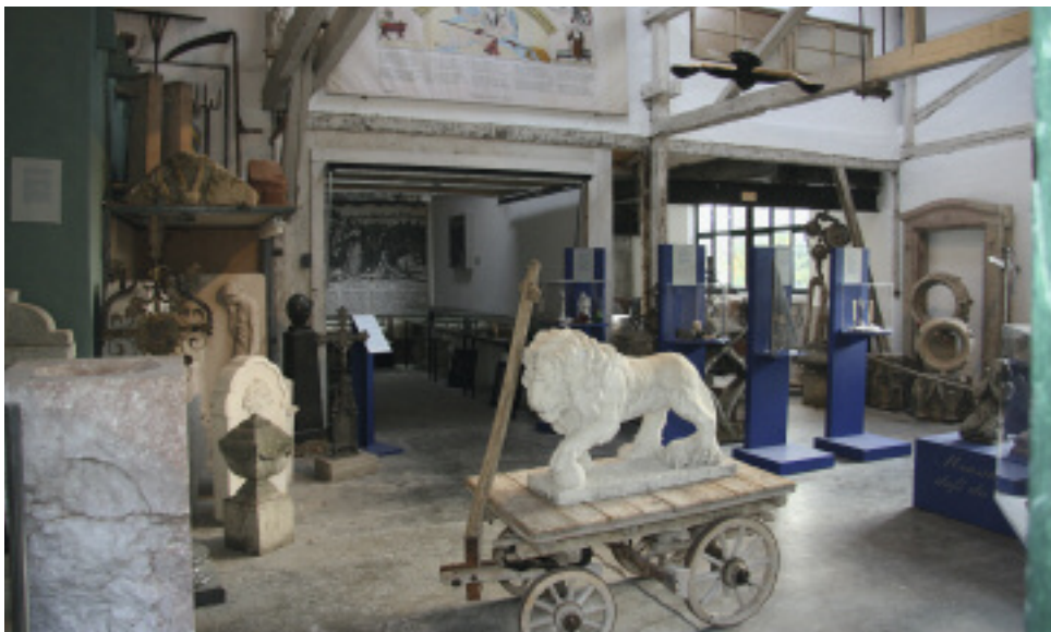
Blick ins Museum, noch mit Exponaten aus dem Museum für Sepulkralkultur

Das Unternehmen beschäftigt acht Mitarbeiter, unter ihnen mehrere Steinmetzprofis mit bis zu 45 Jahren Berufserfahrung und einen Azubi. Einen Teil der Werkzeuge stellt die Firma nach wie vor in der eigenen Schmiede her.