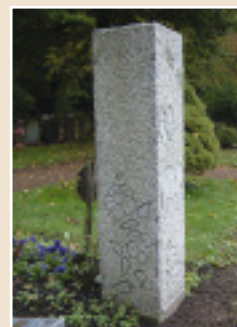
Grabstele für ein Kind auf einem Friedhof in Südbaden. In den Granit sind Tiere und Blumen gehauen.