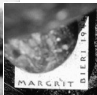
Roman Brunschwiler, 9200 Gossau (Mitglied VSBS), ROUGE DE COLLEGES / Migmatit weiß, 100 x 53 x 30 cm

stellt, gestand Gantner. Sie sei sich aber darin einig, keine Kompromisse eingehen zu wollen. »Sonst wird das Qualitätszeichen unglaubwürdig.« Auch dem wiederholten Vorschlag, einen Publikumspreis einzurichten, erteilte