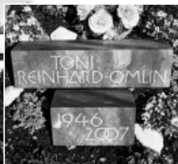
Grabmal von Alois Spichtig, 6072 Sachseln (Mitglied VSBS), Kiesel-Kalk, 100 x 23 x 23 cm / 59 x 11 x 11 cm / 16 x 11 x 11 cm