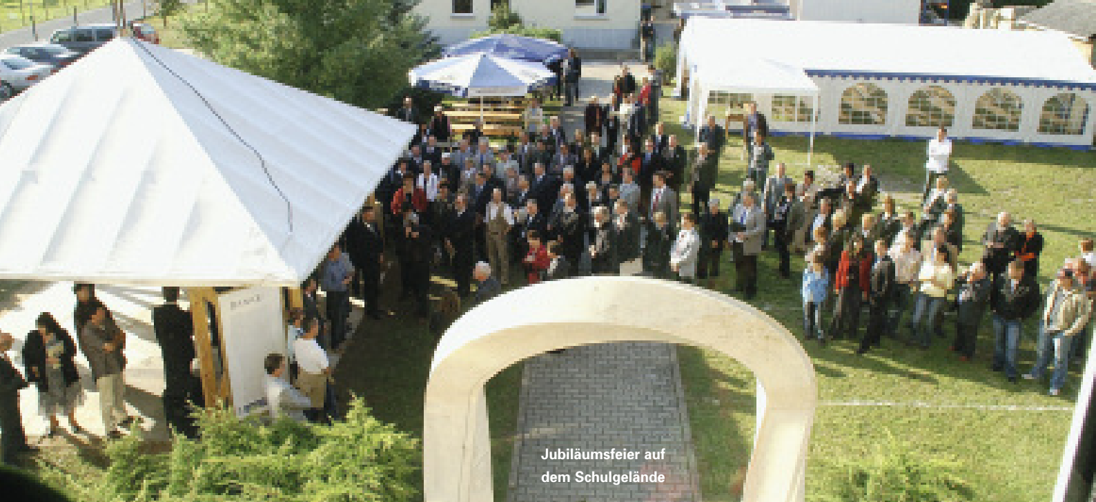
Jubiläumsfeier auf dem Schulgelände

100 Jahre Sächsische Steinmetzschule Demitz-Thumitz: