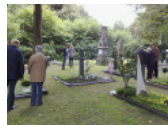
Neues Mustergrabfeld in Kleve