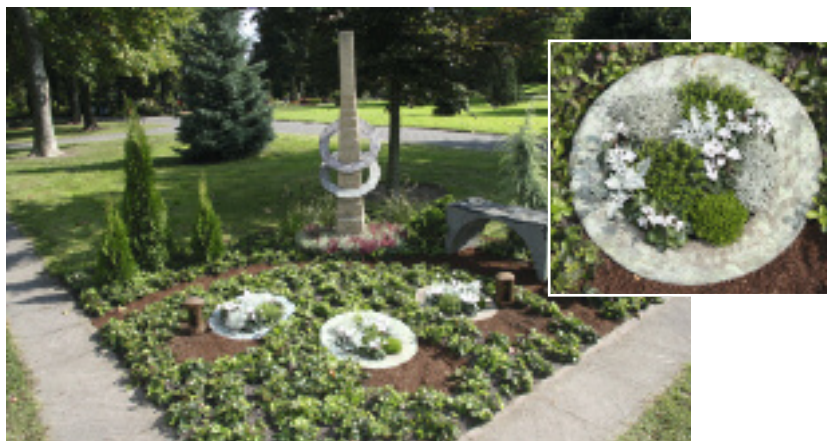
Gruppengrab mit Bronzeringen gestiftet von Strassacker