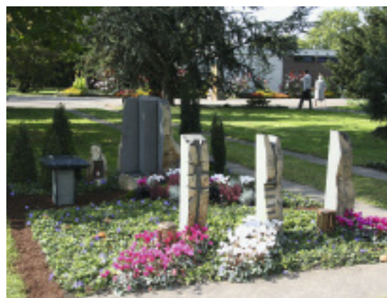
Gruppengrab aus Basaltsäulen; jede Säule wird individuell gestaltet

klärt Görder, d. h., eine Wiesenfläche für 600 Gräber (Erd- und Urnenbestattung!) wurde zentral mit Stelen für die Namensnennung bestückt; die Beisetzung findet dort im Beisein der Hinterbliebenen statt. »Diese Bestattungsart, die anonyme Bestattungen verdrängt hat und heute schon 35% der Friedhofsbelegung ausmacht, spricht vor allem die Intelligenz an«, so Görder. »Mir gehen die Kunden verloren, mit denen man reden kann.« Dass sie falsch entschieden haben, merken viele Angehörige erst, wenn es zu spät ist, nämlich dann, wenn sie den Ort, wo der Verstorbene begraben ist, nicht wiederfinden und nicht schmücken können; Kerzen und Blumen können sie nur zentral ablegen. Während für diese Art der Bestattung riesige neue Felder erschlossen werden, dünnen die Altstadtfriedhöfe aus. »Wenn jede vierte Grabstätte leer steht, wirken die Grabfelder schnell verwahrlost und werden nicht mehr gern besucht«, schildert Görder die Konsequenz. Mitteilungen über Handtaschenraub und Belästigungen schrecken zusätzlich ab.