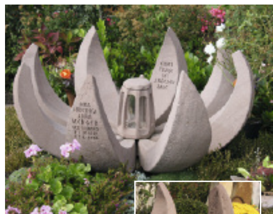
Wandelbares Familiengrab: Jedes Kugelsegment wird individuell gestaltet. Die Segmente lassen sich später zu einer Kugel schließen.