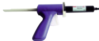
StoneLux® XL-Kartusche mit Applikator

Eine 100 W Quecksilberdampf-Lampe mit einer Lebensdauer von bis zu 2000 Stunden dient als Lichtquelle. Die Lichtleistung ist mit 1 % Genauigkeit individuell steuerbar. Seine schnelle Lichthärtung (innerhalb weniger Sekunden) erleichtert Reparaturen an Wänden, Überkopf und an unebenen Stellen. Das selbstfahrende LED-Flächenlichtgerät »TwinLux Cube« ermöglicht das automatisierte Belichten von langen oder einer Vielzahl kleiner Flächen bei Großanwendungen, denn es erkennt diese selbst. Mit 40 LEDs im Blaulichtbereich von 440 – 480 nm bestückt, kann »TwinLux Cube« eine Fläche von 10 x 10 cm (100 cm 2 ) belichten. Das Gerät zeichnet sich außerdem durch seine »intelligente«