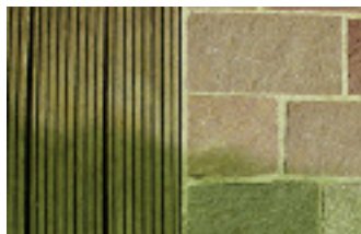
Anti-Grün Longlife zur Entfernung von Grünbelägen

Mit Produktneuheiten präsentierte sich die Firma Akemi auf der diesjährigen Marmomacc. Das Konzentrat »Akemi Anti-Grün Longlife« dient zur dauerhaften Beseitigung von Grünbelägen auf Natur- und Kunststeinen im Außenbereich. Es eignet sich für Terrassen, Fassaden, Treppen und Mauern. Die Wirkung hält laut Hersteller bis zu einem Jahr an und ist vorbeugend gegen grüne und rutschige Beläge. Das Produkt ist frei von Chlor, Säuren, Laugen und Lösemitteln. »Akemi Farbtonvertiefer W« ist eine wassergelöste und umweltfreundliche Spezialimprägnierung. Sie vertieft Farbe und