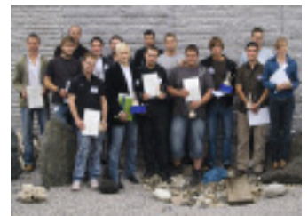
Die Jungesellinnen und Jungesellen der Innungen Hessen-Mitte und Oberhessen