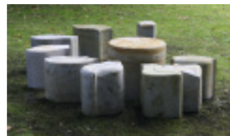
Die Sitzgruppe aus Sandstein, gefertigt von den Lehrlingen des 1. bis 3. Lehrjahres

Die Blumensitzgruppe ist vor dem Kirchenbüro in der Süder- domstraße in Schleswig aufge- stellt.