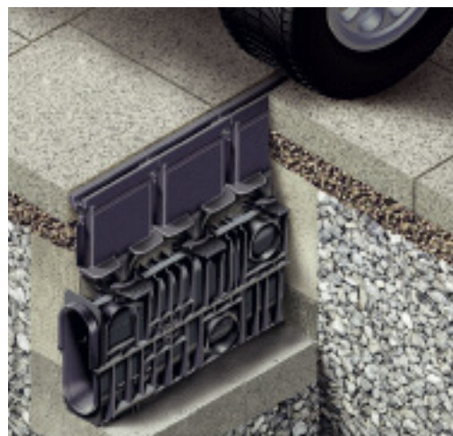
Recyfix Hicap Typ G ist die erste Schlitzrinne aus Guss mit einem Kunststoffunterteil.

Hauraton GmbH & Co. KG Werkstraße 13 76437 Rastatt Tel.: 0 72 22/958-0 Fax: 0 72 22/958-1 00 info@hauraton.com www.hauraton.de