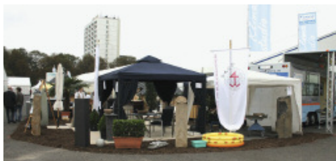
Stand der Innung Krefeld auf der Rheinischen Landesausstellung

zustellen. Der Stand befand sich auf einer mit großformatigen Sandsteinplatten belegten Fläche, u. a. umrahmt von Garten- und Grabstelen. Die Grabausstellung umfasste Urnengräber, Stelen und Einzelgrufte, die in Zusammenarbeit mit den Krefelder Gärtnern präsentiert wurden. Eine Lebende Werk-