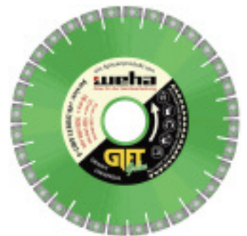
Die neue Trocken-Trennscheibe Gift-Grün mit W-Segment

Die Firma weha hat ihr Trocken-Trennscheibensortiment um den Type Gift-Grün erweitert. Er eignet sich für sämtliche Granite, Quarzite sowie diverse Baumaterialien wie z. B. Beton. Das sog. W-Segment unterscheidet die neue von den herkömmlichen Trocken-Trennscheiben. Durch die spezielle Geometrie werde eine bessere Segmentkühlung sowie ein besserer Materialtransport aus dem Schnitt erreicht, so das Unternehmen. Die Trennscheibe Gift-Grün gibt es momentan mit 115, 125 und 230 mm Durchmesser und einer Belagshöhe von 10 mm. Auf Wunsch liefert weha die Trennscheiben auch mit Flansch.