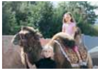
Kamelreiten – ein Highlight insbesondere für die jungen Gäste