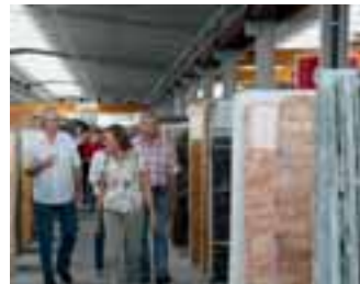
In jedem Gang warteten neue Musterplatten auf die Gäste.