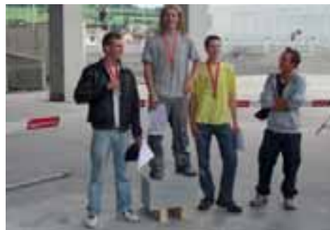
Die vier an der Schweizer Vorausscheidung teilnehmenden Steinmetzen mit dem Sieger auf dem »Podest«