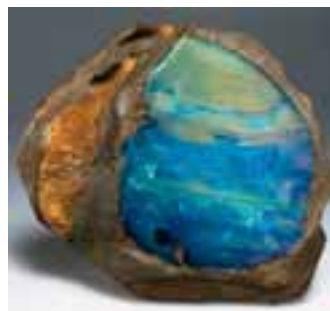
Opale in vielen Variationen zeigt die Sonderschau »Australien«.

Kreidezeit bis zum größten Goldkristall der Welt. Messebesucher können u. a. Gold wa-