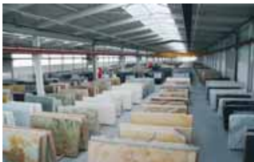
Die neue Halle 7: Naturstein in Hülle und Fülle

Eigene Stände mit Maschinen- und Produktpräsentationen hatten u. a. die Firmen Akemi, Mapei, Möller-Chemie, Lithofin, Haid-tec, Demag, Dürholt, Palette CAD, Dietrich und König. Verschiedene Bands sorgten für Live-Musik. Außerdem gab es eine Samba- und eine Trailshow. Die kleinen Gäste konnten u. a. Kamelreiten und sich auf einer Hüpfburg oder in der Schminke- und Malecke austoben.