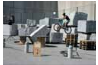
Der deutsche Meister im Trailfahren im Naturstein-Parcour