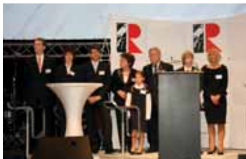
Die Unternehmerfamilie bei der Eröffnung