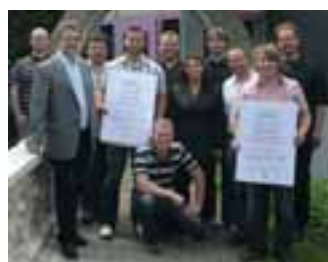
Restaurator(in) im Steinmetzhandwerk: Absolventen 2008