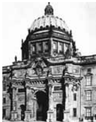
Das Eosander-Portal, 1904