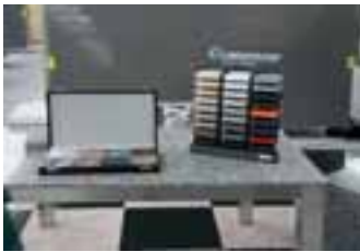
32 Farben CaesarStone® stehen dem Kunden zur Verfügung.