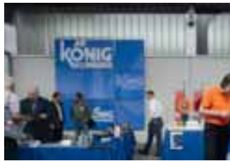
Maschinen und Produkte präsentierte die Firma J. König.