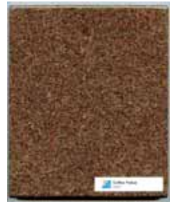
Kommt gut an: COFFEE FLAKES

Naturstein Risse Daimlerstraße 3 59609 Anröchte Tel.: 0 29 47/9 79 90 Fax: 0 29 47/97 99 45 info@naturstein-risse.de www.naturstein-risse.de