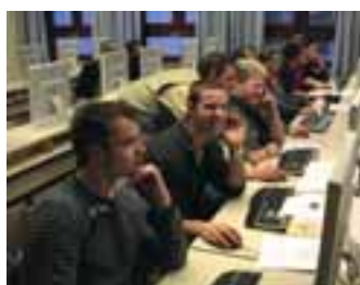
»Steinmetz- und Steinbildhauer in der Denkmalpflege«, 2008