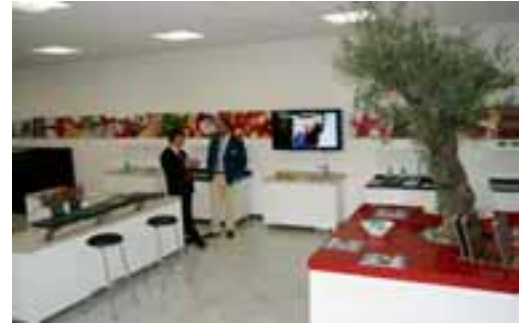
Musterküchen aus Naturstein und Quarzkomposit