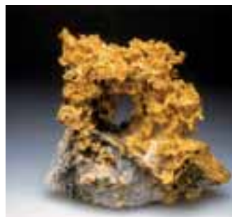
»Gold der Alpen«: Filigrane Goldstufe aus dem Aostatal

Die Sonderschauen »Australien« und »Gold der Alpen« zeigen Fundstücke – vom opalisierten Fischesaurier aus der