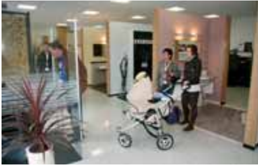
Die neue Ausstellung »Naturstein für Bad und Küche«