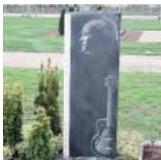
»Imagine«, in Bingen ausgestellte Grabstele der Firma Wehmeyer-Bug