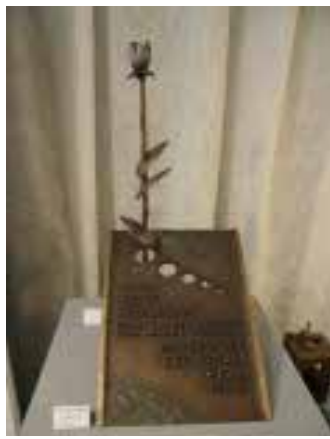
Präsentation der Firma Strassacker

stein Verwendung finden.« Aber die meisten Steinmetze gingen kein Risiko ein. »Man