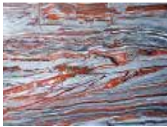
IRON RED aus Brasilien

Im Gala-Bereich bieten wir z. B. ein neues Sortiment an Quarzmaterialien sowie unsere vorge-