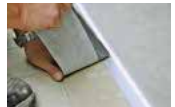
Die neue Rissbrücke WatecFin SK von Gutjahr

Das hessische Unternehmen Gutjahr Innovative Bausysteme hat sich auf Lösungen für schadensfreie Außenbeläge auf Balkonen, Terrassen oder Außentritten spezialisiert. Neueste Entwicklung ist die WatecFin SK Rissbrücke für den sicheren Anschluss von Dichtschlämmen an Randprofile. Sie verfügt über einen 30 mm breiten Selbstklebestreifen mit dem sie direkt auf den Profilschenkel aufgeklebt werden kann. Die Rissbrücke, ein vlieskaschiertes Butyl-Kautschuk-Band, verbindet sich mit der darüber eingebauten mineralischen Abdichtung und dient dem Spannungsausgleich. Sie verhindert Beschädigungen der Abdichtung durch Scherspannungen, die durch