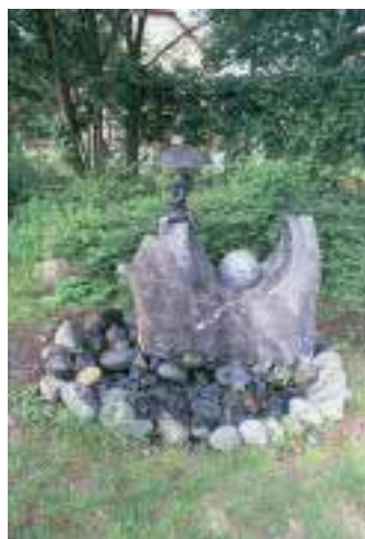
Bronzeminiaur auf Ozeanfindling