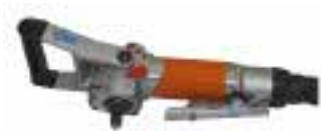
Der neue Winkelschleifer »Scirocco«

Auf ihren diesjährigen Fachtagen am 26. und 27. April stellte die Firma König u. a. zwei Produktneuheiten aus dem Bereich der Druckluft- und Hebeteknik vor: den Winkelschleifer Scirocco sowie den neuen Manzelli-Vakuumheber für Küchenarbeitsplatten. Der Druckluft-Winkelschleifer »Scirocco« ist der Nachfolgetyp zum NDL-Winkelschleifer. Er eignet sich zum Nassschleifen und Polieren von Kanten, Grabmalseiten und engen Radien in Verbindung mit Diamant-Pads. Neu