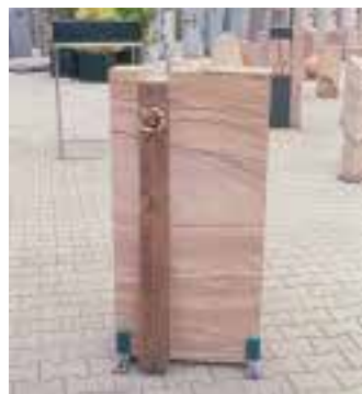
Grabmalform aus REDWOOD mit Bronze von der Gießerei Binder