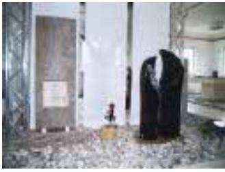
Mustergabsteine, entworfen von Edwin Petri