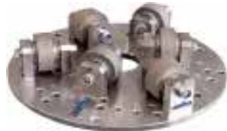
Stockteller von WEHA

Das Lieferprogramm Speedy-»STOCK« und Speedy-»SAND« von WEHA bietet ein breit gefächertes Sortiment an Werkzeugen, die gestockte oder sandgestrahlte Steinoberflächen mittels einer rotierenden Welle (z. B. Wandarmschleifmaschinen, Schleifautomaten, Fußbodenschleifmaschinen, Winkelschleifer, etc.) erzeugen. Ein robuster Aufbau der Werkzeuge und die Liefermöglichkeit aller Einzelkomponenten ermöglichen laut Hersteller eine schnelle und effiziente Erzeugung von rutschfesten