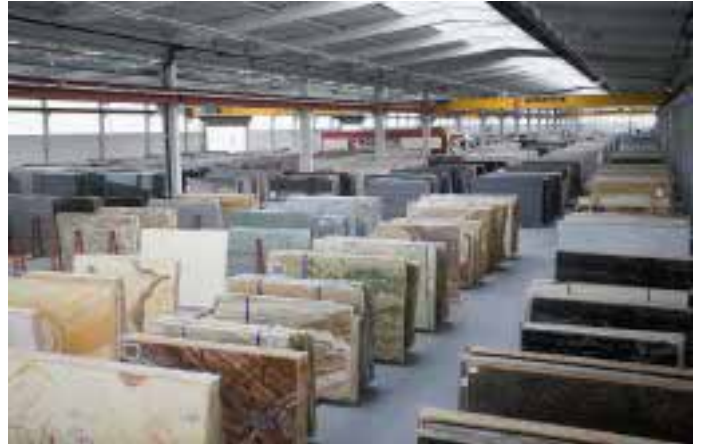
7 Monate Bauzeit für 14 500 m 2 neue Lager und Logistikfläche. 180 neue Natursteinsorten präsentiert Rossittis in der Halle 7.

von Quarzoberflächen. Nur wenige Zeitschriften berichten derzeit noch von Wohnräumen in Naturstein, obwohl es genug Beispiele für fantastische Arbeiten gäbe. Zum einen liegt das an der fehlenden Orientierung in der Medienlandschaft und zum anderen an der Regungslosigkeit der Verarbeiter selbst. Wir warten nicht ab und hoffen auf bessere Zeiten sondern agieren selbst im Markt mit unseren Kunden. Sowohl bei unseren letzten Veranstaltungen in Walldorf und Brinkum als auch in vielen Einzelgesprächen suchen die Verarbeiter gerade jetzt die Allianz in der gemeinsamen Vermarktung. Das neue Selbstverständnis in der Kundenkommunikation drückt sich dadurch aus, dass Händler und Verarbeiter zunehmend gemeinsam in der Öffentlichkeit auftreten, um sich besser in Material, Technik und Service zu präsentieren als industrielle Anbieter mit ihrem Standardprogramm. Ein Novum in der Branche wird die Rossittis-Kundenkarte sein. In Brinkum haben wir bereits seit 2003 testweise mit großem Erfolg Privatkunden, Architekten und Bauherren erfasst, die ohne Begleitung in unsere Ausstellung geschickt wurden. Der Verarbeiter hat durch die erfassten Daten eine größere Sicherheit in der Zuordnung, und unsere Mitarbeiter können sich noch individueller auf die jeweiligen Kunden einstellen.