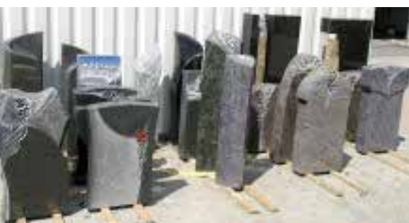
Grabmale aus der Just-Kollektion

Der Handwerker ist kleiner, wendiger, kann schneller reagie-