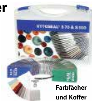
Farbfächer und Koffer

Die Hermann Otto GmbH stellt die Farben ihrer Silicon-Dichtstoffe OTTOSEAL® S 100 und OTTOSEAL® S 70 erstmals in Form eines Farbfächers vor. Die 109 Farbplättchen mit Originalfarbmustern im Format 35 x 35 mm reihen sich an einen Stahlring von transparent bis schwarz, von hell nach dunkel. Jedes Plättchen ist mit der genauen Farbbezeichnung (in deutscher, englischer, französischer und holländischer Sprache) versehen; die Rückseite ist entweder grün (bei OTTOSEAL® S 100) oder blau (OTTOSEAL® S 70). Ein stabiler Kunststoffkoffer schützt den neuen OTTO-Farbfächer vor Staub und Schmutz auf der Baustelle bzw. beim Transport. Der Fächer ergänzt die OTTO-Farbtafeln, die