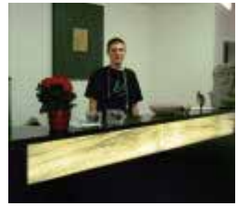
Transluzente Begrüßungstheke im Innenbereich aus hauchdünnem NERO ASSOLUTO