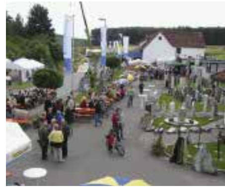
4Plus-Eventtage in Steinweiler

neu geschaffene Ausstellung mit individuell gestalteten Grabmalen besichtigen. Als Neuheit wurden u. a. bodenebene Duschtassen vorgestellt. Außerdem gab es Gewinnaktionen, eine Vorführung mit CNC-gesteuerten Maschinen und Auskunft zu Bodenbelägen, Gartenaccessoires sowie zur Renovierung von Treppen und Terrassen. Interessenten konnten sich über die Berufsbilder Steinmetz und Steinbildhauer sowie Naturwerksteinmechaniker informieren.