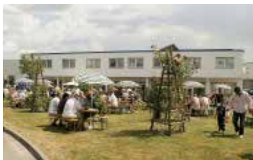
Besucher aus ganz Deutschland kamen nach Loitsche.

alles garniert mit kleinen Häppchen. Mitaussteller waren die Firma Seltra mit einer schönen Auswahl an Terrassenplatten und die Firma Quarella-Steinindustriebedarf. Herbert Fahrenkrog referierte zum Thema »Innovative neue und wiederentdeckte Materialien für die Küche« mit dem Schwerpunkt: »Wie verkaufe ich Qualität?«. Die Besucher erlebten zudem vier Blocksägen in Aktion und vor allem die erst 2007 neu aufgebaute computergesteuerte Kalibrier- und Schleifmaschine