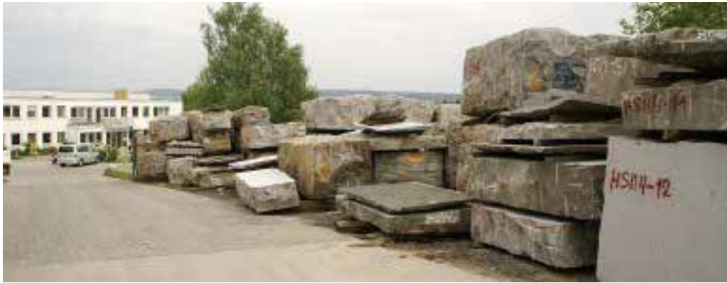
Das Blocklager aus Granit, Marmor und Sandstein

dellpolitik: Man muss immer etwas Besonderes bieten, und zwar für alle Interessen und jeden Geschmack«.