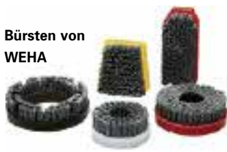
Bürsten von WEHA

Ludwig Werwein GmbH Wikingerstraße 15 86343 Königsbrunn Tel.: 08231/6007-0 Fax: 08231/6007-132 info@weha.com www.weha.de