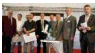
Die Ausgezeichneten mit den beiden Preisverleihern Rode und Seif

Auf dem Hessentag in Bad Homburg am 10. Juni verliehen Staatssekretär Karl-Winfried Seif vom Umweltministerium und LIM Holger Rode erstmals das Steinmetz-Gestalter-Zeichen des LIV Hessen. Das drei Jahre gültige Gestaltungszeichen erhielten die Firmen