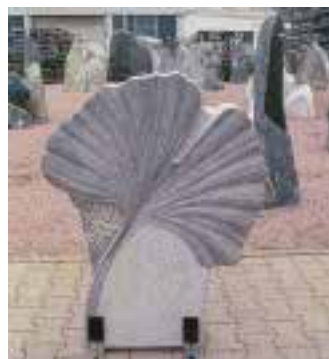
Blatt des Ginkgo-Baumes (in Japan Symbol für Leben) aus indischem Granit