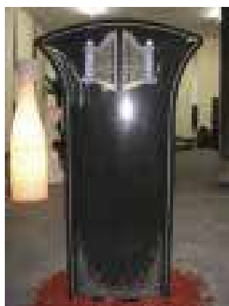
Grabmal aus Diabas