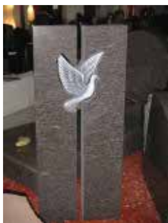
Grabmal aus ROYAL BROWN

Binder – Atelier für künstlerische Bronzegestaltung Tel.: 0 71 62/83 26 www.binder-bronzen.de