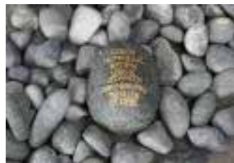
Handstein zum Mit-Nachhause-Nehmen