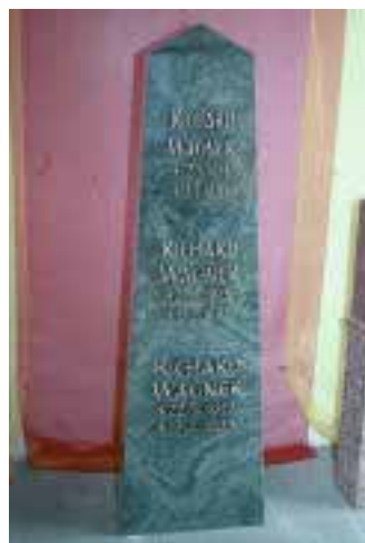
Neue Schrift »La Pieta«.