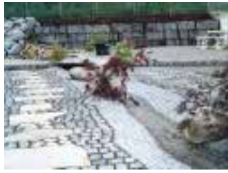
Beispiele für Pflaster und Wege im Landschafts- und Gartenbau

gewagt und sich dann 2001 zum Aufbau des jetzt fertig gestellten eigenen Betriebs entschlossen.