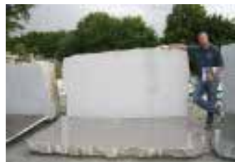
ROYAL BROWN, im Bild GF Jörg Knell