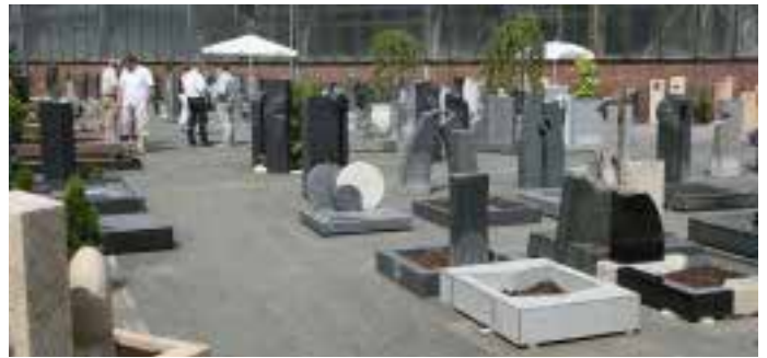
Vielfalt bei Büttner