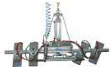
Der neue Vakuumheber von Manzelli

(TK 180) von 0° bis 180° gedreht werden können. Dadurch bieten sich laut König mehr Einsatzmöglichkeiten. Ansonsten verfügen diese Modelle wie alle anderen über vier rostfreie Saugplatten aus Edelstahl, die einzeln verschoben und abgesperrt werden können, und sie sind für polierte, raue, geflammte und gebürstete Flächen geeignet. Die Rahmenkonstruktion ist aus rostfreiem, elektrogeschweißtem Qualitätsstahl, der Reserve-Vakuum-Behälter aus Aluminium. Arbeitsplatten mit Ausschnitten oder kleinere Platten können problemlos gehoben werden und sorgen, dank eines akustischen und optischen Warnsystems, für sicheres Heben und Transportie-