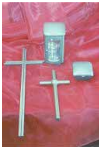
Edelstahl- und Aluminium-Modelle mit neuer Beschichtung

Rottenecker GmbH Tel.: 0 78 08/9 49 7-0 www.rottenecker.de