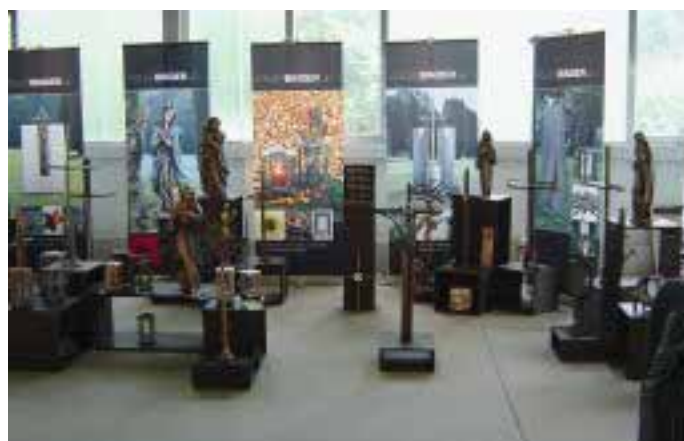
Exponate der Firma Binder