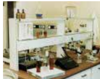
Labor des iba- INSTITUTS

beraten sie Hausbesitzer in Energiefragen und veranstalten Seminare. Zum 15-Jährigen wurde im Januar zum Tag der offenen Tür geladen. Am 13. November findet das iba-BauFach-Symposium »Forum Estrich & Belag; Risiko Restfeuchte« statt, in dessen Rahmen iba-Sachverständige u. a. anhand von Praxisbeispielen Einblicke in ihre Erfahrung und Tätigkeit vermitteln.