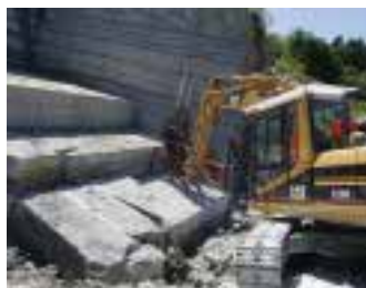
Demonstration im Steinbruch