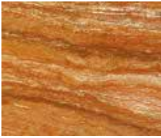
Trendmaterial Travertin Red

für Rohplatten. Entsprechend groß war das Interesse. »Für diese 80 m lange Anlage haben wir unsere Produktionshalle um 2 500 m 2 erweitert«, berichtete Thumm (Firmenporträt siehe