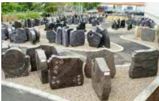
Ausstellung der Firma Böse