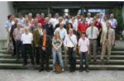
Tagungsgäste, Veranstalter und Referenten vor Schloss Wartensee