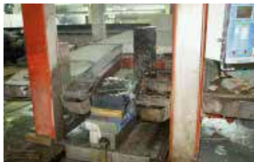
Horizontalseilsäge von Burkhardt