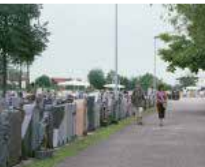
Auf der Hausmesse der Jogerst Steintechnologie GmbH waren mehr als 2000 Grabmäler auf 3500 m 2 zu sehen.

Jogerst Stein-Technologie GmbH Tel.: 0 78 02 / 70 44 99 - 0 www.jogerst-steintechnologie.de