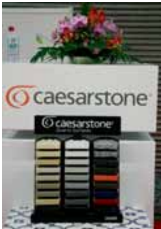
Eine von 14 Säulen im Rossittis-Sortiment: Quarzwerkstoff CaesarStone®

GOLDSTONE NEDERLAND BV seit 10 Jahren ihr Natursteinspezialist