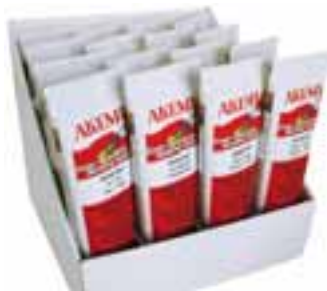
MIXBOND-Kleber von Akemi

AKEMI chemisch technische Spezialfabrik GmbH Lechstraße 28 90451 Nürnberg Tel.: 09 11/64 29 60 Fax: 09 11/64 44 56 info@akemi.de www.akemi.com