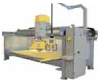
Die Brückensäge BRIO

Die Brückensäge Brio ist das Basismodell der Drehkopfmaschinen-Baureihe von Gmm in Monoblock-Bauweise, bei der kein Betonfundament erforderlich ist. Serienmäßig ist die Maschine bereits mit Folgeschnittautomatik und Kipptisch ausgestattet. Eine Gehrungsschnitteinrichtung wird optional angeboten. Die Drehkopftechnik erlaubt eine kompakte Bauweise, so dass die Maschinentiefe nur 2 500 mm beträgt. Durch den Drehsupport werden die Positionierungszeiten gegenüber herkömmlichen Brückensägen laut Hersteller deutlich verkürzt. Das Modell BRIO 35 TO verfügt u. a. über eine Vollschnittfunktion für Weichgestein und eine Absenk-Automatik zur Granit-Verarbeitung. Der Support ist mittels Schrittmotor um 180° drehbar, so dass Längs-, Quer- und Diagonalschnitte durch Achseninterpolation durchführbar sind. Die Bedienung für die manuelle oder automatische Bearbeitung erfolgt über einen flexibel am Auslegearm aufgehängten Touchscreen. Der einsetzbare Trennscheiben-Durchmesser beträgt 400 bis 625 mm. Auf der Brückensäge Brio bietet sich z. B. der Einsatz der »White Shark« an. Die von König neu entwickelte und in Karlsruhe produzierte Trennscheibe, die