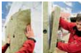
Einsatz an vier Wänden: Die neue Fassadendämmplatte Kernrock

Die nichtbrennbaren Fassadendämmplatten (Klasse A1) werden im Format 1 200 x 600 mm und in Dicken zwischen 50 und 150 mm geliefert. Der spezifische Strömungswiderstand der Steinwolle sorgt zudem für eine hohe Schallabsorption und trägt zu einem guten Schall-