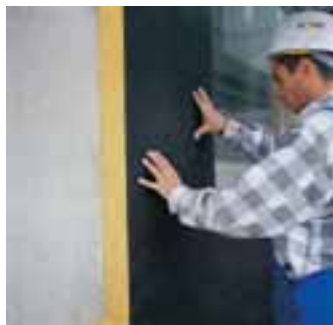
Isover Fassaden-Dämmplatte Kontur »Easy Fix«

Kontur FSP 1-035 Easy Fix ist der »Allrounder« unter den Iso-