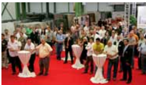
Top-Verarbeiter informierten sich am 30. und 31. Mai bei Rossittis über den Arbeitsplattenmarkt und CaesarStone®.