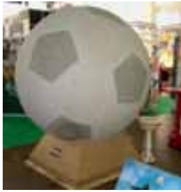
Der Granitfußball mit einem Durchmesser von 2008 mm

Steinmetzmeister Helmut Moser aus dem österreichischen Seekirchen hat einen überdimensionalen Fußball aus Granit gefertigt. In Anlehnung an die Fußball EM besitzt die knapp 3 t schwere und 2,5 m hohe Kugel einen Durchmesser von 2008 mm. Zusammengesetzt ist sie aus 20 hellen Sechsecken aus TARN-GRANIT und zwölf dunklen Fünfecken aus IMPALA-GRANIT. Die Materialstärke der insgesamt 32 Teile mit gestockter und scharrierter