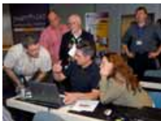
Austausch auf den Palette CAD-Anwendertagen im letzten Jahr

Am 3. und 4. Juli finden in Fulda die Palette-Anwendertage 2008 statt. Auf dem Programm stehen neben intensivem Training von Software-Kenntnissen auch Workshops zu speziellen Sachgebieten, Vorträge anerkannter Experten und Diskussionsrunden. Dem Eröffnungsvortrag von Dr. Zinser zum Thema »künstlerischer Blick und Handwerk« folgen Veranstaltungen zur perfekten digitalen Fotografie, zur richtigen Beleuchtung sowie zur künstlerischen Gestaltung und Präsentation mit Palette CAD. Daneben stehen bewährte Klassiker wie »Tipps und Tricks vom Profi« auf dem Programm.