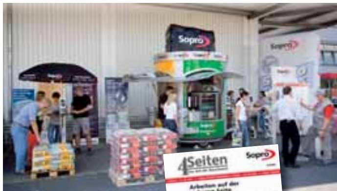
Roadshow von Sopro

Sopro Bauchemie GmbH Biebricher Straße 74 65203 Wiesbaden Tel.: 06 11/17 07-0 Fax: 06 11/17 07-250 www.sopro.com