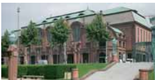
Das Congress Center Rosengarten in Mannheim

Remmers Baustofftechnik GmbH Bernhard-Remmers-Straße 13 49624 Lönigen Tel.: 0 54 32/83-8 58 Fax: 0 54 32/83-7 59 www.remmers.de