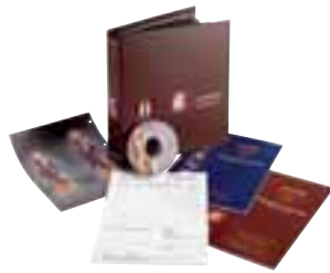
Der neue Katalog von Weha

Registrierte Fachhandelskunden von Weha bekommen den Katalog automatisch zugeschickt, Neukunden auf Anfrage. Als Verkaufsunterstützung bietet das Unternehmen den Katalog im PDF-Format auf CD (dem