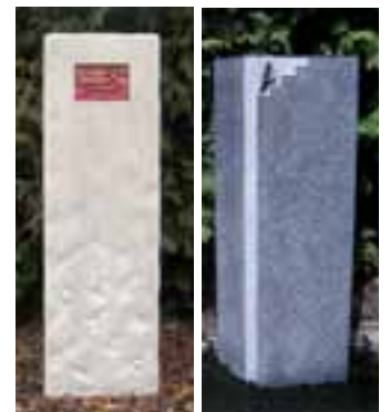
Grabmale von Thust

Gut gestaltete Grabzeichen in Marmor und anderen Gesteinen präsentiert die Firma Thust in einem neuen Katalog. Abgebildet sind Stelen, Breitsteine und Grabmale mit oder ohne Einfassung auch für Urnengräber. Neben Hartgesteinen werden vor allem bewährte Marmore und wetterfeste Kalksteine verwendet und in den Werken in Balduinsteinstein und Merseburg mit zeitgemäßen wie auch traditionellen Techniken bearbeitet.