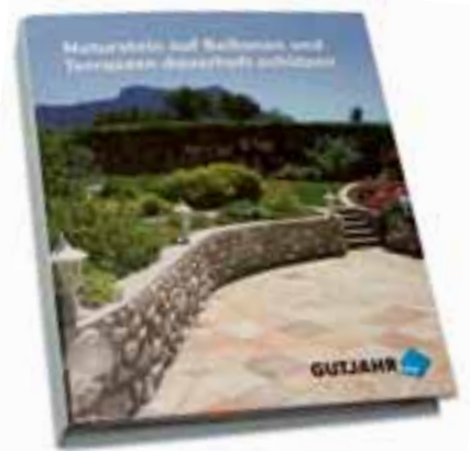
Der von Gutjahr initiierte Naturstein-Ordner

Gutjahr bietet Fachunternehmen bereits seit zwei Jahrzehnten verlängerte Funktionsgarantien für seine Drainagesysteme. Partnerschaften mit den Bauchemie-Herstellern PCI und Mapei ermöglichen dem Balkonspezialisten, jetzt erstmals eine fünfjährige System-Gewährleistung für die Verlegung von Naturwerkstein auf Einkornmörtel anzubieten. Mit AquaDrain EK hat Gutjahr eine spezielle Drainagematte für die Verlegung von Naturwerkstein auf Einkornmörtel entwickelt. PCI und Mapei liefern jeweils die passenden bauchemischen Produkte. Zusammen gewährleisten die Unternehmen jeweils, dass weder Feuchtigkeit noch Frost den Aufbau schädigen.