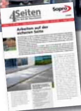
Der neue Sopro-Newsletter für Verlegeprofis