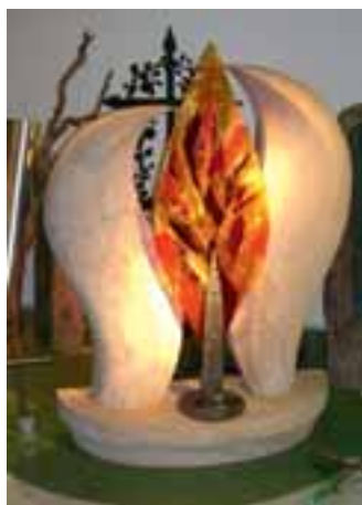
Auf der Hausmesse gezeigter REGENBOGEN SANDSTEIN mit Glasblatt

Kunst-Steinmetz Pointner Ges.m.b.H Bergstraße 1 A-4716 Hofkirchen / Tr. Tel.: 00 43/6 99/11 11 14 22 kunststeinmetz@gmx.at www.stoneart.at