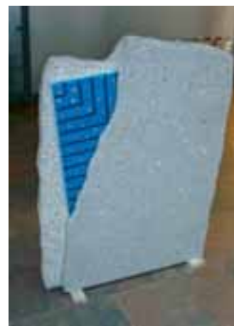
WOLFSTEINER GRANIT mit Glaselement