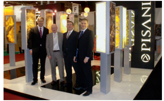
Zufriedene Aussteller, hier bei Pisani