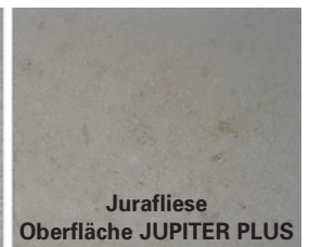
Jurafliese Oberfläche JUPITER PLUS