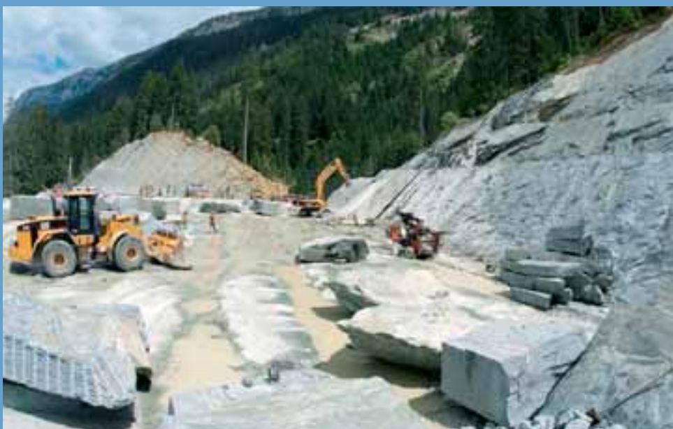
Der ANDEER-Steinbruch der Toscano AG bei Andeer