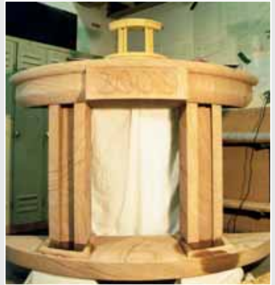
Kaminmaske mit Wasserspiel von Martin-Willi Tripp