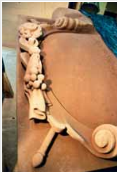
Teilausgearbeitetes Wappen für die Mainzer Befestigungsanlage Zitadelle von Martin Kopatz