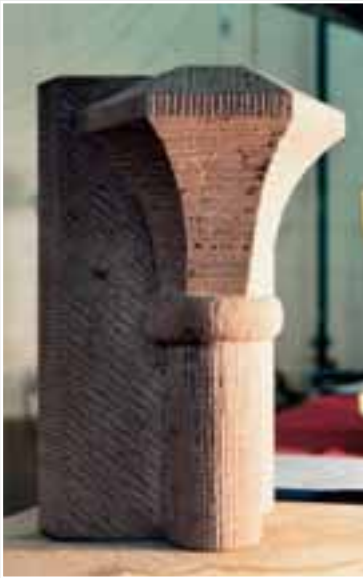
Im Rahmen der Prüfung entstandene Arbeitsproben