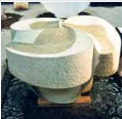
Kleeblattbrunnen von Christoph Knüpfer, Granit