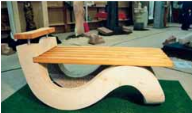
Thomas Pöhlmann: Gartenbank aus Kalkstein in Kombination mit Holz und Edelstahl