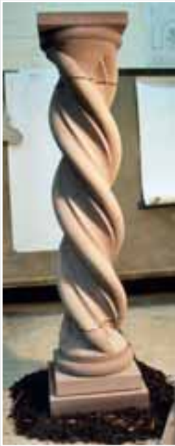
Gedrehte Säule von Martin Alles