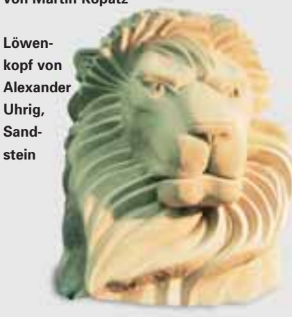
Löwen- kopf von Alexander Uhrig, Sand- stein