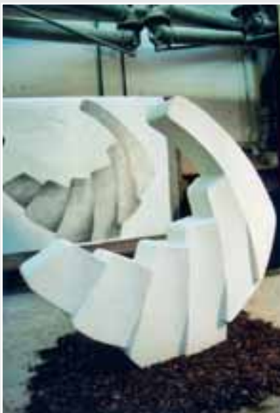
»Metamorphose«, Steinraupe von Florian Faaß, Kalkstein