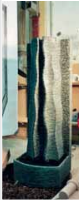
Brunnen aus Diabas von Manuel Engelbrecht