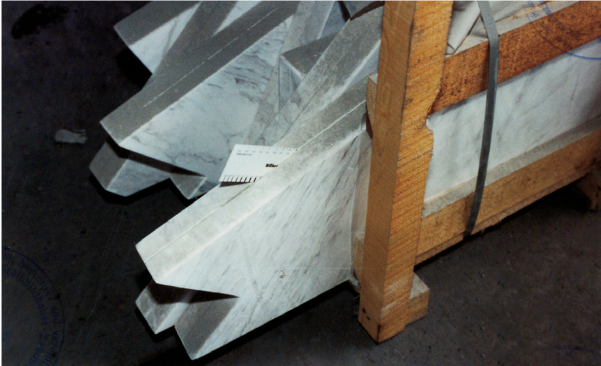
Fotolineal in der Klebefuge

nutzen ließen. Wie der Sachverständige erfuhr, hatte der Kunde, der zunächst eine andere Marmorsorte geordert hatte, eine Umbestellung vorgenommen, d. h. einen anderen Marmor mit geprüfter Mindestfestigkeit gewählt. Die bereits kommissionierte Ware wurde zu Stufen zugeschnitten und geliefert.