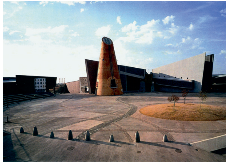
Eigenwillige Platzgestaltung mit afrikanischem Naturstein in Kimberley / Südafrika

für die Casa del Puente in Sierra Amatepec (Mexico) mit mexikanischem Travertin und italienischem VERDE SAINT DENISE.