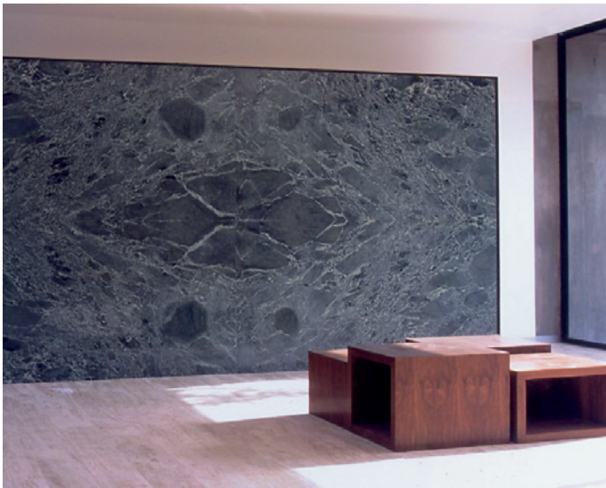
Mexikanischer Travertin und italienischer VERDE SAINT DENISE in der Casa del Puente im mexikanischen Sierra Amatepec