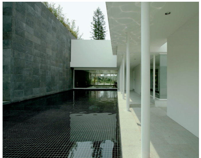
In der Casa AV in Mexico City wurden mexikanischer Naturstein und griechischer THASSOS kombiniert.

Marble Architectural Awards zur CarraraMarmotec 2008: