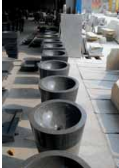
Meister des Kopierens: Zeitgenössisches europäisches Design made in China

verteuerten Frachtkosten, der fallende US-Dollar und die sich beschleunigende Inflation, die in China gegenwärtig bei etwa 10% liegt, wirken sich auf die chinesischen Exporte empfindlich preissteigernd aus. Bereits haben einzelne chinesische Natursteinproduzenten ihre Verarbeitung in (noch) preisgünsti-