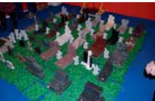
Das Angebot an Grabmalen war in Xiamen vielseitiger denn je. Hier ein »Miniaturfriedhof« eines chinesischen Anbieters, der hauptsächlich den europäischen Markt beliefert.

Doch nicht nur quantitativ, auch qualitativ hat sich die »Xiamen Stone Fair« in den vergangenen Jahren außerordentlich positiv entwickelt. Vor allem ist sie wesentlich internationaler geworden. Inzwischen preisen hier Unternehmen aus allen wichtigen Produzentenländern ihre Steine an. Bemerkenswert auch, dass Brasilien, Indien und der Iran in Xiamen erstmals mit nationalen Gemeinschaftsständen vertreten waren. Zudem hatten die bereits in früheren Jahren teilnehmenden Delegationen aus der Türkei, Italien und Spanien ihre Präsentationen vergrößert.