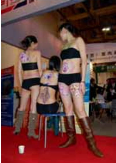
Werbung mit nackter Haut – jetzt auch auf Steinfachmessen im einst prüden China zu sehen

verteuerten Frachtkosten, der fallende US-Dollar und die sich beschleunigende Inflation, die in China gegenwärtig bei etwa 10% liegt, wirken sich auf die chinesischen Exporte empfindlich preissteigernd aus. Bereits haben einzelne chinesische Natursteinproduzenten ihre Verarbeitung in (noch) preisgünsti-