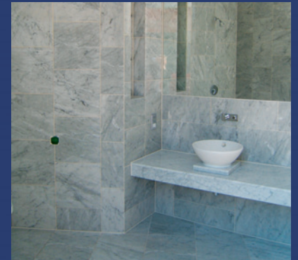
Von der Firma Rasselstein eingebautes Aquacel-Bad

Die Rasselstein GmbH ist Spezialist für die Ausstattung von Hotels mit Aquacel-Fertigbädern, die als komplette Einheit individuell nach Kundenwünschen hergestellt und als voll ausgestat-