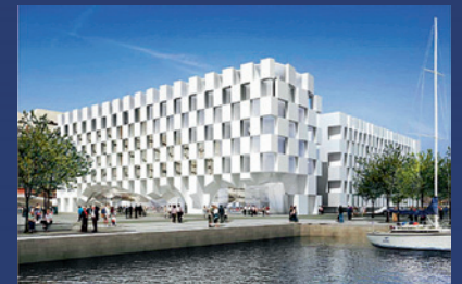
Le Meridian-Hotel in Dublin

tete Badezimmer betriebsfertig angeliefert und montiert werden. Zur werkseitigen Ausstattung gehören u. a. Wand- und Bodenbeläge, Anstriche sowie die Elektroinstallation und die komplette Heizungs-, Lüftungs- und Sanitäreinrichtung. Mehr als 80 000 Bäder in über 800 Bauvarianten hat das Unternehmen bereits installiert.