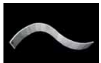
»Stonelastic«: Die Steinplatten sind flexibel verbunden

Mármoles Ocará Tel.: 00 34/9 50/12 63 63 Fax: 00 34/9 50/12 88 97 info@marmolesocara.com www.marmolesocara.com