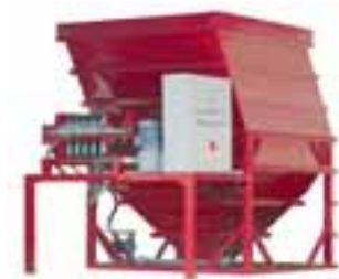
Wasseraufbereitungsanlage vom Typ VMP 40 aus der neuen Serie von ECS Eich

matisch und trocknet den aus dem Klärer über die mitgelieferte Schlammpumpe zugeführten Schlamm zu festen Kuchen. Die Presse ist mit einer Plattenrüttlung ausgestattet, die einen