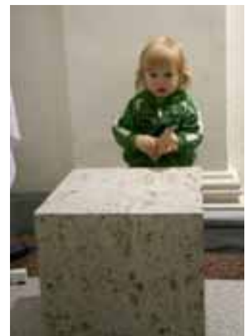
Einer von vielen ausgestellten Steinwürfeln aus Baden-Württemberg

wunderten die Exponate, darunter die Ergebnisse des Gestaltungswettbewerbs-Grabzeichen und die Ausstellung »Steinwürfel aus Baden-Württemberg«, und genossen dann eine Stadt-