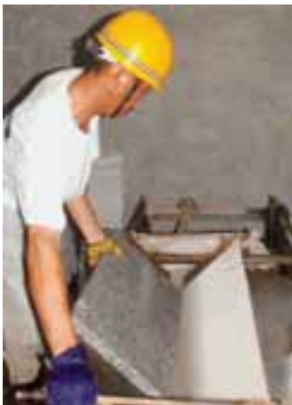
Produktion bei East Raise Stone