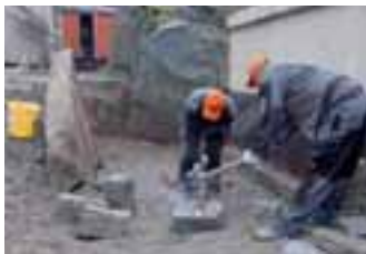
Tag der offenen Tür bei VSG

eine historische Werkzeugschmiede. Auf reges Besucherinteresse stießen der Schaugarten der VSG und die mit Blocksteinen in einen Hang gebaute »Arena di Graniti«. Die VSG gewinnt in fünf eigenen Brüchen u. a. RAUMÜNZACHER, SEEBACHER und ROTENBERGER GRANIT.