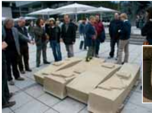
Von Lehrlingen gefertigt: Landkarte von Baden-Württemberg aus Sandstein