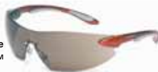
Die Sicherheitsbrille SPERIAN Ignite™

Sperian Protection Germany Postfach 111165 23521 Lübeck 04 51 / 70 27 40 04 51 / 79 80 58 info@spelianprotection.com www.spelianprotection.eu