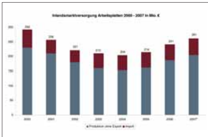
* 1. Halbjahr 2007, hochgerechnet auf 2007 gesamt Quelle: Unternehmensberatung Titze GmbH (Hrsg.): Der Markt für Arbeitsplatten bis 2010, Neuss 2008

Wo der Kunde früher die Entscheidung zwischen den verschiedensten Dekoren von Schichtstoffarbeitsplatten traf oder sich – wenn er etwas ganz