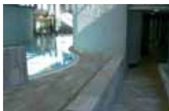
Erlebnisbad in Burghausen

Beläge in Schwimmbädern sind in aller Regel einer Dauernassbelastung ausgesetzt. Zudem schreibt die Reinigungsverordnung für öffentliche Bäder eine wechselnde Reinigung mit alkalischen und sauren Reinigungslösungen sowie eine tägliche Desinfektion vor. Diese Prozedur müssen Naturstein und Fugen aushalten. Hinzu kommt die mechanische Belastung durch in Burgahusen bis zu 2 000 Badegäste pro Tag. Gefordert war somit ein gut haftendes, mechanisch hoch belastbares und gegen die Reini-