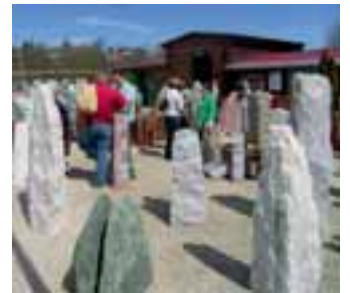
Frühjahrsmesse der Firma Donderer

Natursteine Donderer oHG Unterm Ablaß 9 88605 Meßkirch Tel.: 0 75 75/92 44 40 Fax: 0 75 75/92 44 14 info@natursteinedonderer.de www.natursteinedonderer.de