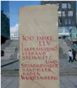
Werbung fürs Handwerk auf dem Schlossplatz