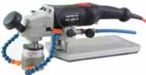
Die »Contour Cat« ist die verbesserte Weiterentwicklung der Kantenbearbeitungsmaschine »Sinus KS«

GALESKI Werkzeuge und Maschinen Boschstrasse 4 + 7 56457 Westerburg Industriegebiet Sainscheid Tel.: 0 26 63 / 94 37 - 0 Fax: 0 26 63 / 94 37 - 37 info@galeski.de www.galeski.de