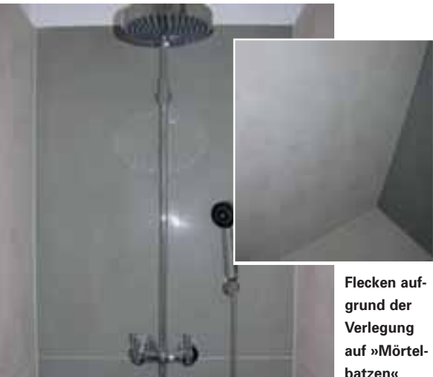
Flecken auf- grund der Verlegung auf »Mörtel- batzen«

»dichter« bzw. je geringer der Porenraum, desto besser geeignet für den Einsatz im Nassbereich. In »dichte« Gesteine dringt weniger Wasser ein; entsprechend gering ist das Risiko einer mikrobiologischen Besiedlung und entsprechend groß ist die Beständigkeit gegen Aggressorien und Fleckenbildner. Dieses optimale Eigenschaftsprofil hat beispielsweise die Gesteinsart Quarzit. Die Experten weisen darauf hin, dass ungeeignete Gesteine durch eine Imprägnierung nicht so eingeschränkt für den Nassbereich geeignet sind. Ein Naturstein sollte die gestellten Anforderungen primär, d. h. ohne Schutzbehandlung, erfüllen.