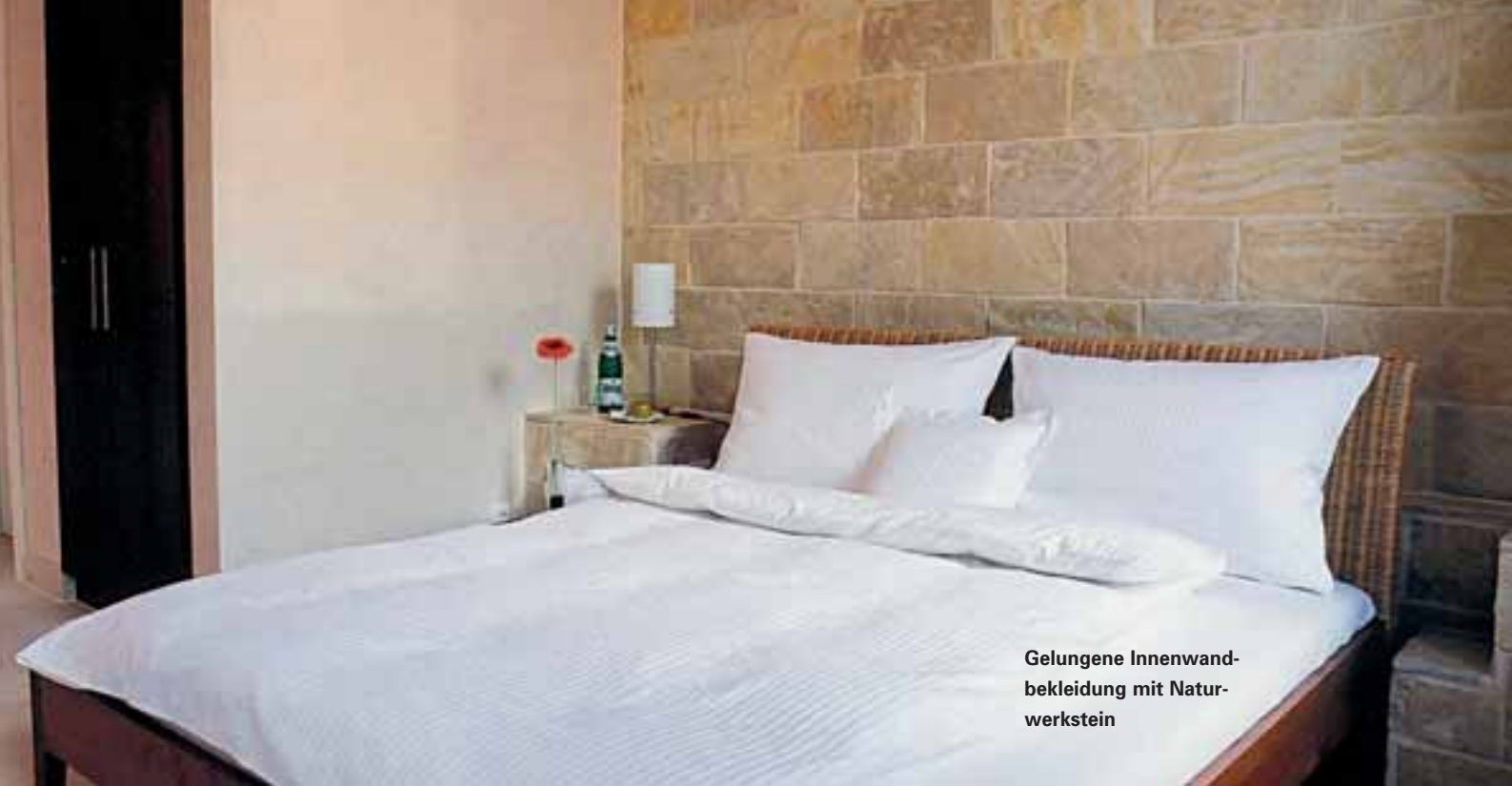
Gelungene Innenwand- bekleidung mit Natur- werkstein