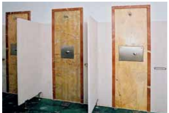
Mit Naturstein bekleidete Wandabschnitte im Nassbereich