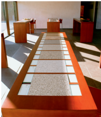
Schulungszentrum von Schwanekamp

Naturstein: Inwieweit bringen Sie sich gestalterisch in Ihre Produkte ein? Setzen Sie selbst Trends?