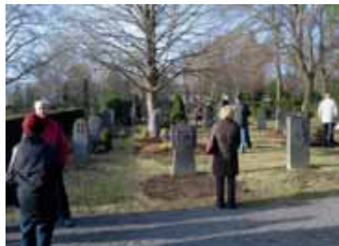
Besuch des »Wogerfeldes«

den 1950er Jahren angelegtes Mustergrabfeld mit handwerklich gestalteten Grabmalen aus heimischem Material (v. a. Basaltlava). Auf Initiative einiger ehemaliger Fachschüler konnte es unter Mithilfe der Stadt Mayen bewahrt und für die Nachwelt erhalten werden. Am Eingang befindet sich eine neue Stele von Willi Völker.