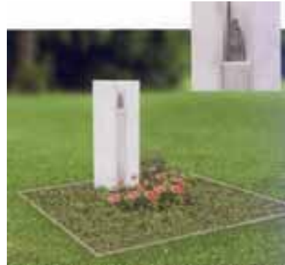
Ausstellung »Memento«: Doppelstele, Entwurf und Umsetzung: Steinmetzmeister Friedhold Scheunert, Stollberg

Kontakt: Stadt Weimar Tel.: 0 36 43 / 76 29 38 www.weimar.de