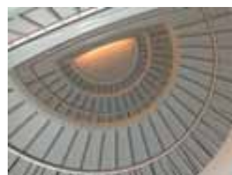
Treppe aus RORSCHACHER SANDSTEIN

Veranstaltungsort ist das Tagungs- und Begegnungszentrum Schloss Wartensee. Anmeldeschluss ist der 31. Mai. Da die Teilnehmerzahl begrenzt ist, lohnt sich eine frühzeitige Anmeldung. Die Tagungsgebühr beträgt 190 € (295 CHF) pro Person und beinhaltet die ge-