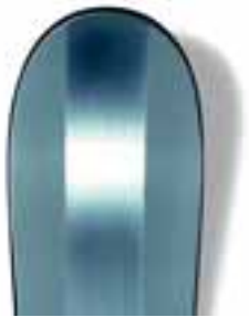
CFS im Ski: Modell der zai AG