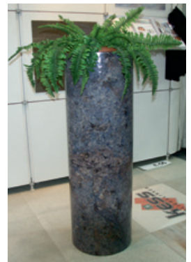
Säule mit DekoStein