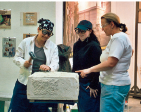
Lebende Werkstatt der Berliner Innung