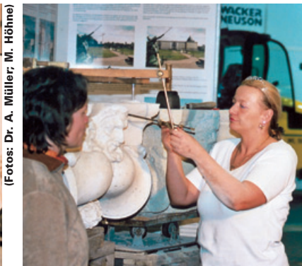
Werbung für das Projekt Stadtschloss