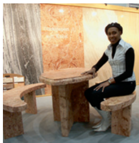
ROSSO CAMPINA CORALL von Werner Knake