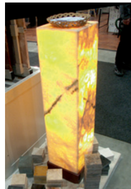
Honigonyx von Steinzeit