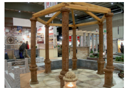
Laube mit Säulen aus FLORIANOTUFF von Bäumler