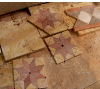
Persischer Travertin von Persien Naturstein