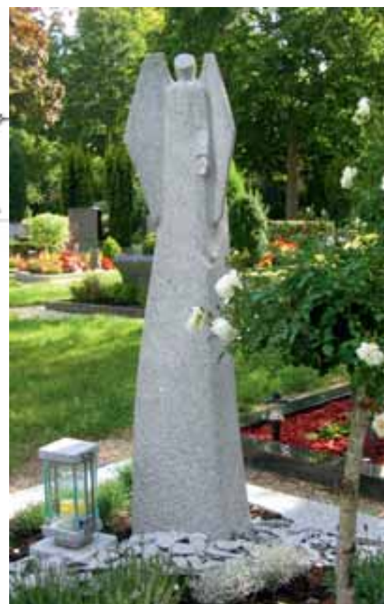
Grabstellenentwurf (oben) und ausgeführte Engelstele

Benedikt Kreuzsch verbindet Stein mit Edelstahl und besonders gerne mit Glas. Dieses Rad habe er zwar nicht erfunden, gibt er freimütig zu, aber aufmerksame Besucher von Friedhöfen im Kreis Kleve werden schnell feststellen, dass der Klever Steinmetz dieses Rad sehr wohl angestoßen hat