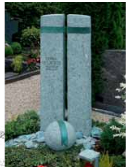
Entwurf einer Grabstelle und ausgeführtes Grabmal