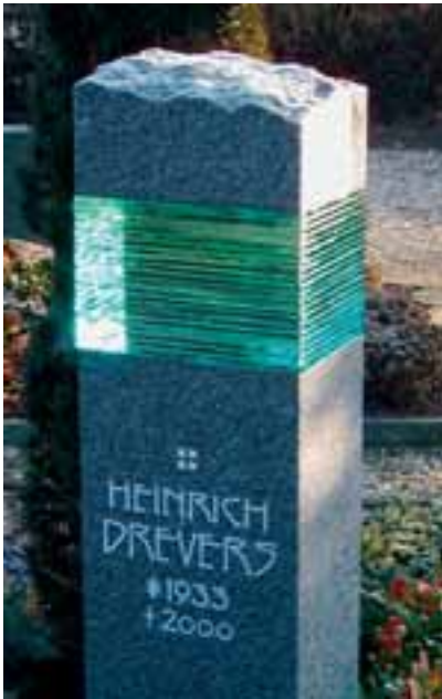
Gerne verbindet Kreusch Stein mit Glas.