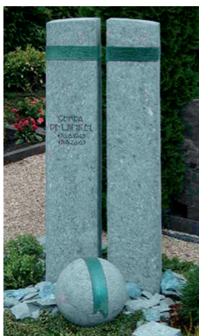
Stein und Glas kombiniert der auf die personenbezogene Grabmalgestaltung spezialisierte Steinbildhauer Benedikt Kreusch aus Kleve. Mehr dazu