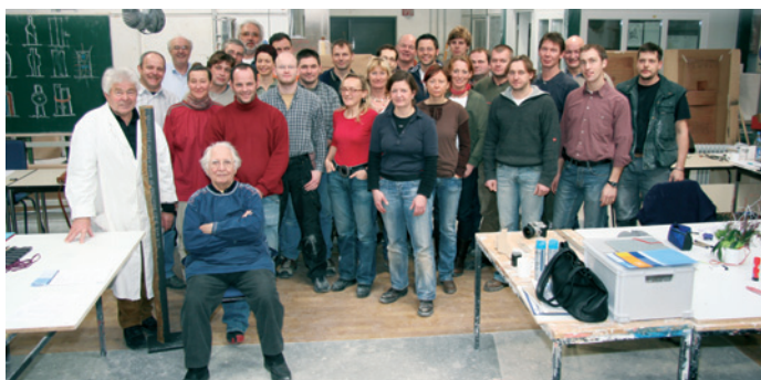
Eine Bereicherung für alle Teilnehmer war das Gestaltungseminar des LIV Bayern im Bildungszentrum Ingolstadt. Unser Bericht beginnt