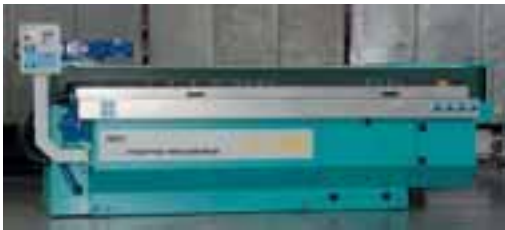
Kantenautomat LTV 621

Wenn wir schon dabei sind: Im Beitrag »Kantenautomaten LTT 621 und LTV 621« (Maschine im Fokus 81) haben wir ein falsches Bild abgedruckt. Die Aufnahme mit der Bildunterschrift »Kantenautomat LTV 621 für vertikal stehende Werkstücke« zeigt fälschlicherweise den Kantenautomaten LTT 621 . Hier der Kantenautomat LTV 621 von marmo meccanica (Vertrieb: W. Goldschmidt).