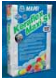
Flexkleber »Mapei Keraflex Maxi S1«

gen für über 1 800 Natursteine aufgelistet. Die neue Anwenderbroschüre gibt es kostenlos bei Mapei.