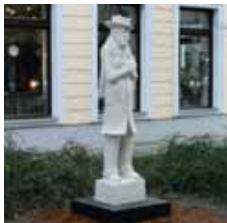
Denkmal für Heinrich Zille