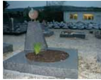
Liegesteine und Urnengrabanlagen von Dassel

NKA Naturstein Kontor Allagen 59581 Warstein-Allagen Tel.: 0 29 25/81 78-22 info@nkallagen.de www.nk-allagen.de