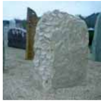
Felsenstein mit Rosenornament von NKA