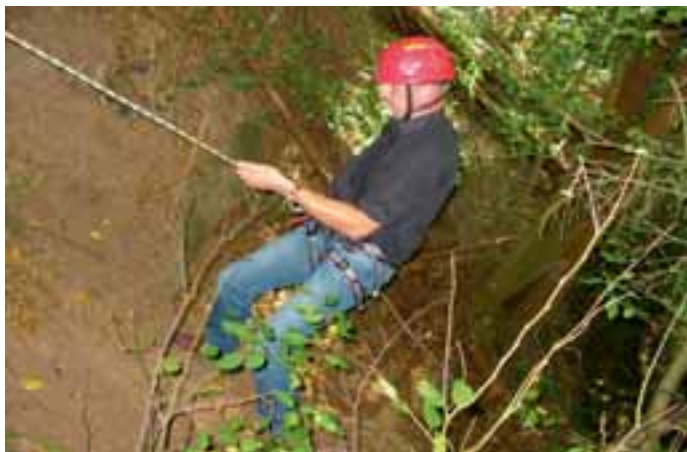
Abseilen am Steilhang

Kunstgießerei Plein GmbH Bahnhofstraße 69 54662 Speicher Tel.: 0 65 62/96 73-0 Fax: 0 65 62/20 16 info@plein.de www.plein.de