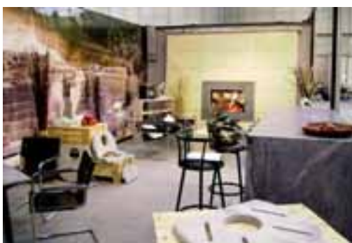
Stand von Grein Italia auf der Messe Progetto Fuoco in Verona

Seit Ende 2006 bietet Grein Italia auch Produkte aus Speckstein an. Seine neue Specksteinlinie präsentierte das Unternehmen vom 24. bis 27. Januar auf der Progetto Fuoco 2008, der internationalen Fachausstellung für die Wärme- und Energieerzeugung mit Holzverbrennung in Verona. Der Mirasol Speckstein aus Brasilien zeichnet sich laut Grein Italia v. a. durch große Wärmespeicherkapazität aus. Bis zu acht bzw. zehn Stunden wird die Wärme gespeichert. Das Material kann auf bis zu 1250 Grad erhitzt werden. Das Original aus Brasilien weist keinerlei Schadstoffe wie Asbest auf und ist sowohl für Kachelöfen als auch für BBQ und Herdplatte geeignet.