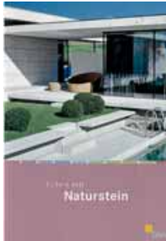
»Leben mit Naturstein« zeigt die neue DNV-Wohnbaubroschüre.

beratung sowohl für den Bauherren als auch den Architekten Anregung sowie Beratungs- und Planungshilfe bieten. Mit über 100 zum Teil großformatigen Farbbildern werden auf 52 Seiten die wichtigsten Anwendungsbereiche des Naturwerksteins im privaten Wohnungsbau vorgestellt. Die dargestellten Beispiele zeigen einen repräsentativen Querschnitt des gehobenen, aktuellen Wohnungsbaus in Deutschland. Durch einen Firmeneindruck können Natursteinanbieter die Wohnbaubroschüre auch zur Imagewerbung nutzen.