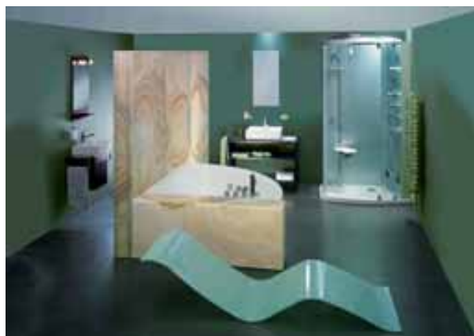
Onyx im Bad- und Wellnessbereich

Emilio Stecher AG Werkstrasse 15 CH-6037 Root Tel.: 00 41/41/4 50 00 50 Fax: 00 41/41/4 50 00 51 natursteine@stecher.ch www.stecher.ch