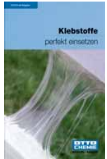
Zwei Ratgeber von Otto-Chemie, die auch für den Natursteinprofi nützlich sind.