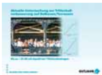
Broschüre zur Studie über Trittschallverbesserung auf Balkonen

Philipp-Reis-Str. 5-7 64404 Bickenbach/Bergstraße Tel.: 062 57/93 06-0 Fax: 062 57/93 06 31 info@gutjahr.com www.gutjahr.com