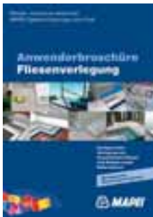
Die neue Anwenderbroschüre von Mapei

In der Anwenderbroschüre »System-Know-how vom Profi« informiert Mapei auf 44 Seiten Verarbeiter und Fachhändler über die fachgerechte Verlegung von keramischen Fliesen und Platten sowie Naturwerksteinen. Profis finden Lösungen für unterschiedlichste Probleme aus der täglichen Praxis. Einen breiten Raum nehmen die verschiedenen Untergründe zur Verlegung ein. Für jeden Untergrund bietet die Broschüre neben einer präzisen Skizzierung der Problematik die entsprechende Lösung in Form einer Produkt- und Systemempfehlung – Schritt für Schritt, von der Untergrundvorbehandlung über das Verlegen bis hin zum Verfugen.