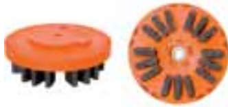
Tap Flex Satinierbürste von König

Ob satiniert oder mattgeschliffen – im exklusiven Innenausbau und zur Präsentation hochwertiger Produkte ist die Nachfrage nach Naturstein mit neuer Oberflächenoptik groß. Die Firma König bietet Bürsten an, die den optischen Effekt satinierter Oberflächen erzeugen. Zunächst wird die Oberfläche mit einem diamantbesetzten Vorschleifwerkzeug bearbeitet. Sie wird aufgeraut, indem die Borsten vorwiegend die weichen Teile des Gesteins aushöhlen. Anschließend wird der Stein mit der Tap Flex Satinierbürste bearbeitet, die die Oberfläche durch flexible Schleiflamellen glättet und schleift, um danach mit den feineren Körnungen Struktur und Farbe hervorzu- bringen. Mit den Tap Flex Satinierbürsten, die auch für den Einsatz auf Kantenschleifmaschinen geeignet sind, wird laut König ein hoher Arbeitsfortschritt erreicht. Zusätzlich bietet die Firma König den Oberflächenschutz nanoinduro an. Nach dem einmaligen Auftragen des aus nano-Partikeln bestehenden Produkts wird die Oberfläche mit einer Art Netzwerk überzogen und durch die öl-, fett – und säure-