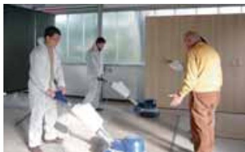
Teilnehmer und Trainer in der neuen Schulungshalle von Finalit

Auf den Schulungsflächen sind alle gängigen Belagsmaterialien wie Schiefer, Granit, Feinsteinzeug, Marmor, Terrazzo, Solnhofener Platten, Sandstein, Cotto, Glasmosaik, Holz und Parkett verlegt. Alle Produkte können auf diesen Bodenflächen und