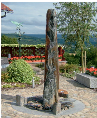
Mit Naturstein gestalteter Außenbereich