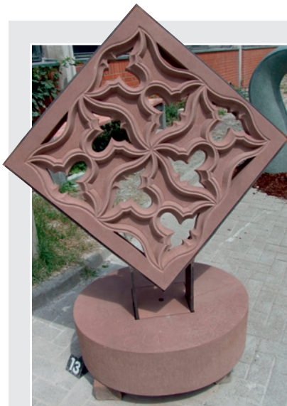
»Gegensätze« von Silke Rumpf, SEEDORFER SANDSTEIN (80 x 80 x 25 cm)