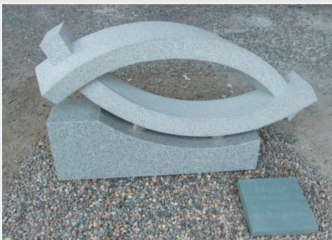
»0. T.« von Marco Bichlmeier, BAYERWALD GRANIT (140 x 50 x 30 cm)