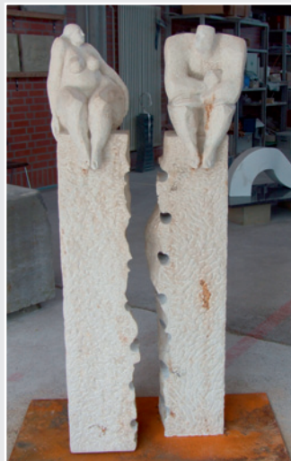
»Frau und Mann« von Lucia Torge, Kalkstein (jeweils 150 x 25 x 25 cm)