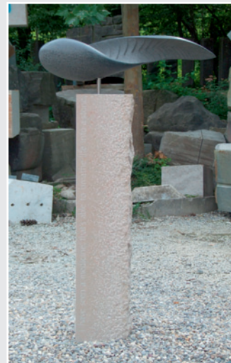
»Belebter Stein« von Florian Kraus, SCHWARZER SCHWEDE, COM-BLANCHIEN CLAIR (165 x 80 x 25 cm)