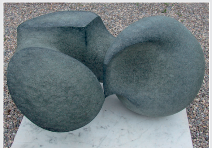
»Polaritten« von Daniel Hörl, Olivin Diabas (115 x 65 x 72 cm)