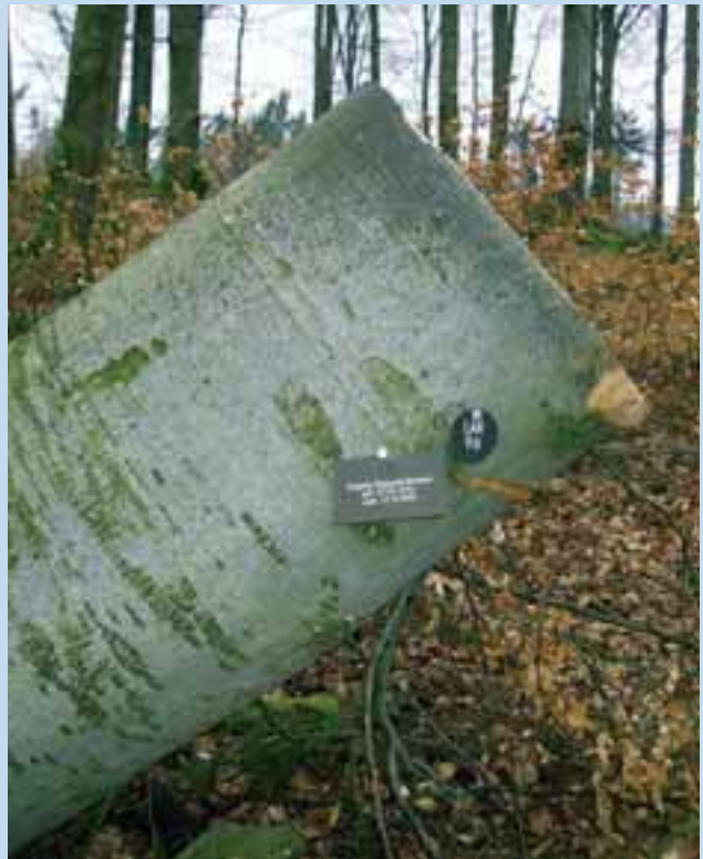
Vor gut einem Jahr fällte das Sturmtief Kyrill allein in Nordrhein-Westfalen 22 Mio. Bäume. Die Aufnahme zeigt einen umgestürzten Baum im Friedwald in Bad Laasphe (Kreis Siegen-Wittgenstein).