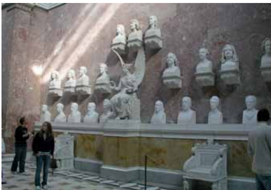
Die bayerische Ruhmeshalle Walhalla

In diesem Jahr soll eine Abbildung der während der Herrschaft der Nationalsozialisten ermordeten Ordensschwester Edith Stein (1891–1942) auf-