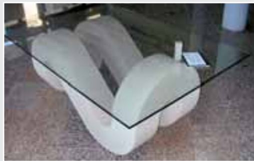
Tisch von Rouven-Renè Dost, Sandstein »Hahnbruch«