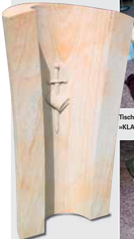
Stele von Alexander Wieczorek, BUCHER SANDSTEIN