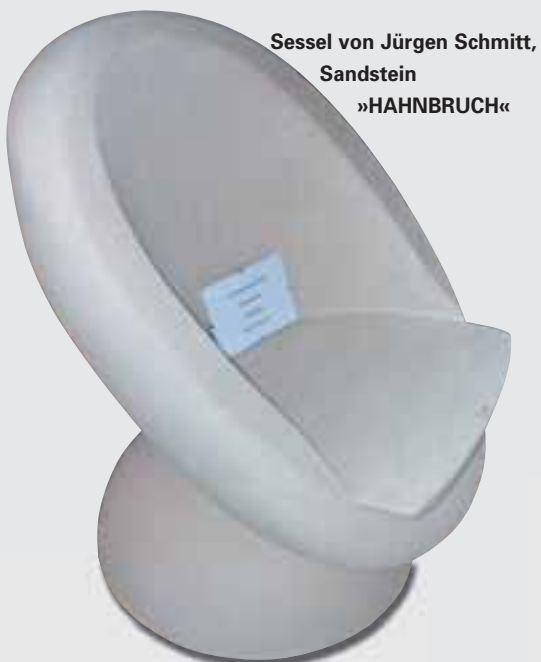
Sessel von Jürgen Schmitt, Sandstein »HAHNBRUCH«