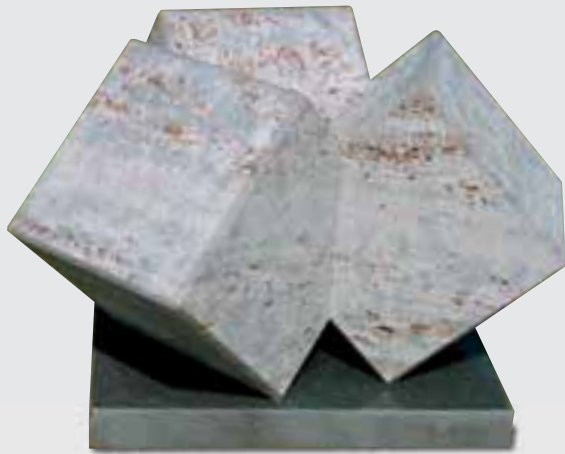
Würfelobjekt von Stefan Rau, KIRCHHEIMER MUSCHELKALK