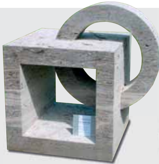
Gartenobjekt von Dieter Silberhorn, KIRCHHEIMER MUSCHELKALK