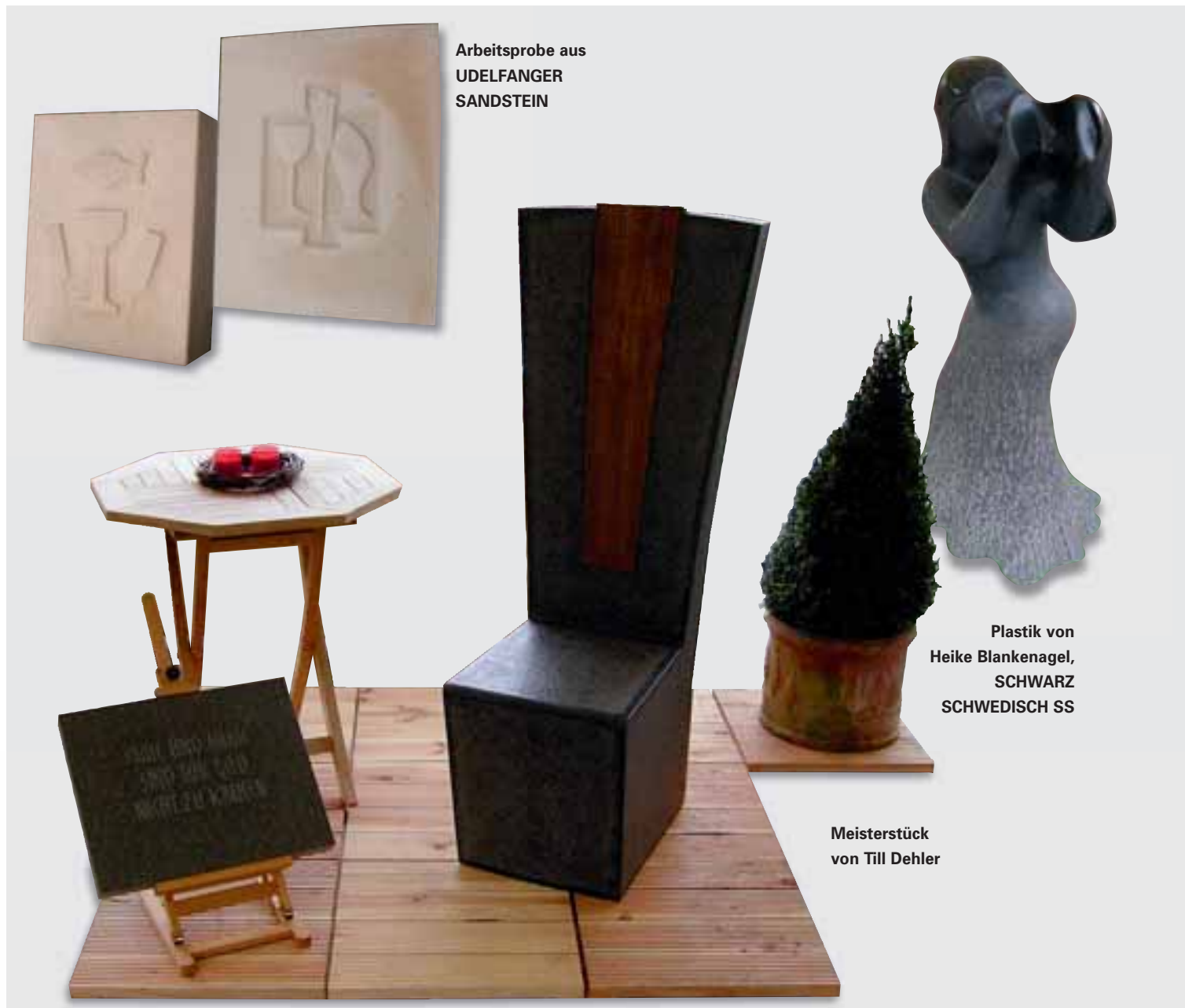
Arbeitsprobe aus UELFANGER SANDSTEIN