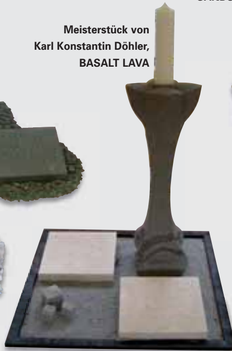
Meisterstück von Karl Konstantin Döhler, BASALT LAVA