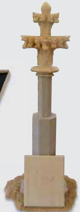
Meisterstück von Domenico Grandi, BOZANOV SANDSTEIN