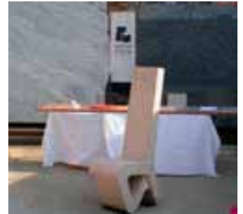
Werbung mit dem Logo

Hahnel: In der Öffentlichkeit sollte Naturstein besser beworben werden (z. B. in der Tagespresse), damit die vielseitigen Anwendungsmöglichkeiten noch bekannter werden.