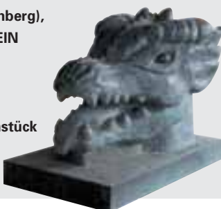
Drachenkopf, Gesellenstück von Ferdinand Walter (Bayern), Diabas