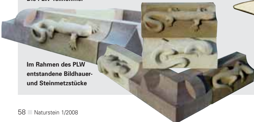
Im Rahmen des PLW entstandene Bildhauer- und Steinmetzstücke