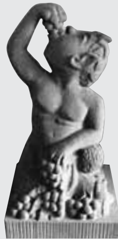
»Kleiner Satyr«, Gesellenstück von Philipp Bartz (Rheinland-Pfalz), UDELFANGER SANDSTEIN