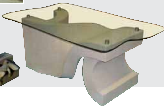
1. Platz im Wettbewerb »DIE GUTE FORM« (Steinmetzen): Arbeit von Peter Nöth (Schweinfurt)