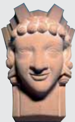
Gotischer Bogenfänger, Gesellenstück von Samuel Seger (Baden-Württemberg), MAINTALER SANDSTEIN