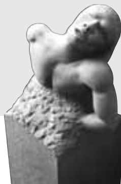
Gesellenstück von Peter Benedykjnski (Saarland), UDELFANGER SANDSTEIN