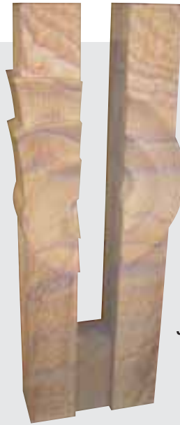
3. Platz im Wettbewerb »DIE GUTE FORM« (Steinmetzen): Arbeit von Sven Heeg