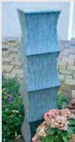
Gartenstele, Gesellenstück von Benjamin Wind (Nordrhein-Westfalen), Diabas