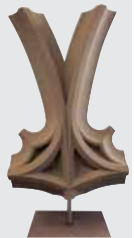
Teilstück eines gotischen Maßwerkfensters, Gesellenstück von Matthias Wittner (Bayern), SCHÖNBUNNER SANDSTEIN