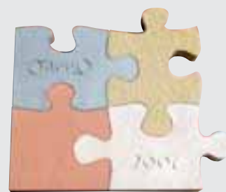
Steinpuzzle, Gesellenstück von Timo Schwinn (Hessen), BOLLINGER, NECKARTÄLER, UDELFANGER und SCHÖNBUNNER SANDSTEIN