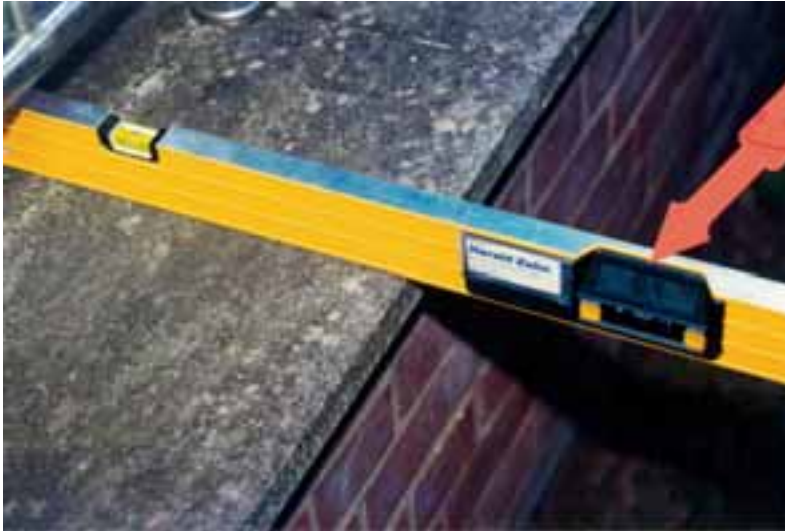
Geringes Gefälle und geringer Überstand nach Architekturvorgaben

Bauherr teilnahm. Der bestand auf einer auch bei abendlicher Sonne makellosen Bodenfläche ohne Dehnfugen (siehe Bild 1).