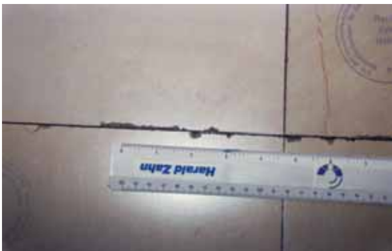
Kantenabplatzungen aufgrund zu schmaler Fugen und ohne Dehnfugen