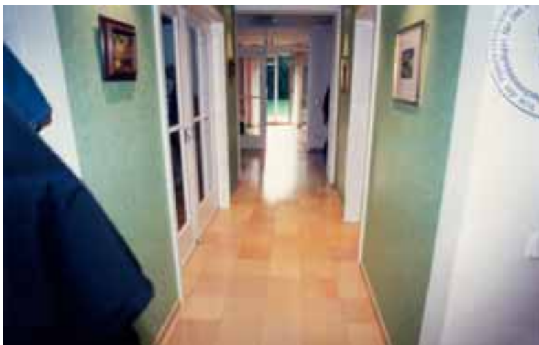
Durchgang Altbau-Anbau ohne Dehnfuge

Der Sachverständige zog in Vorbereitung seines Gutachtens den auf Juramarmor und SOLNHOFENER PLATTEN spezialisierten Sachverständigen Helmut H. Huf-