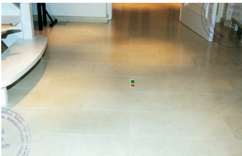
Bemängelte Farbunterschiede im Bereich der Treppe

Der Sachverständige stellte beim Ortstermin diverse Risse und auch Abplatzungen in den Fugen fest. Nach Vorlage des ersten Gutachtens wurden im Rahmen des Beweisverfahrens weitere Fragen gestellt. Der Sachverständige erhielt den Auftrag, den Boden zu öffnen und den Konstruktionsaufbau zu prüfen. Im Zuge dieses zweiten Ortstermins wurde auch ein mängelfreies Vergleichsobjekt besichtigt, das die Bauherrschaft zu der Gestaltung ihrer Beläge bewogen hatte.