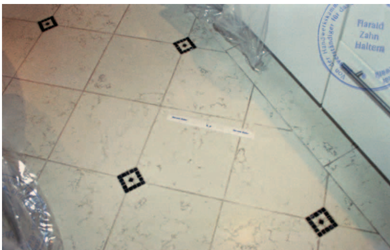
Fugenabplatzungen in der Küche