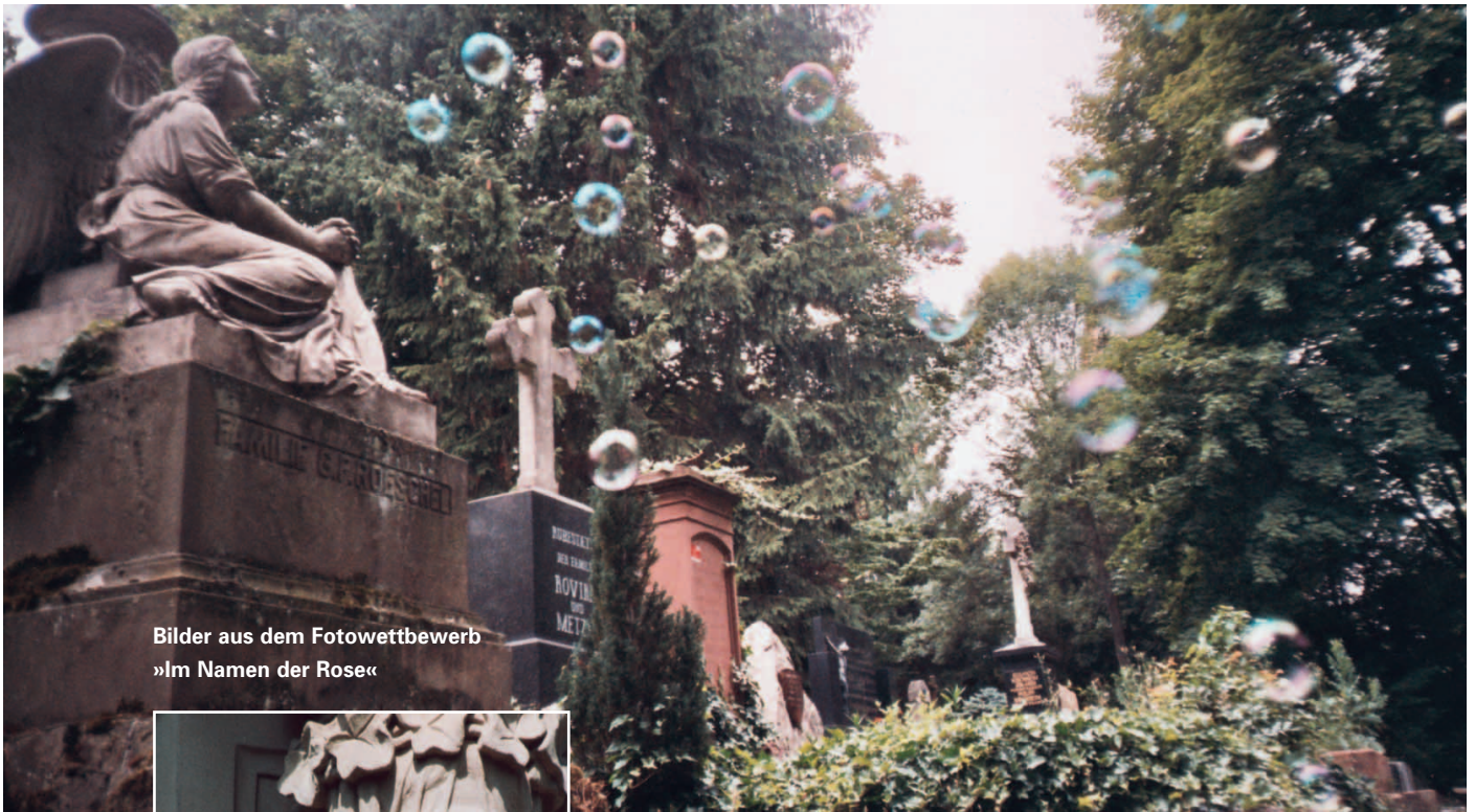
Bilder aus dem Fotowettbewerb »Im Namen der Rose«