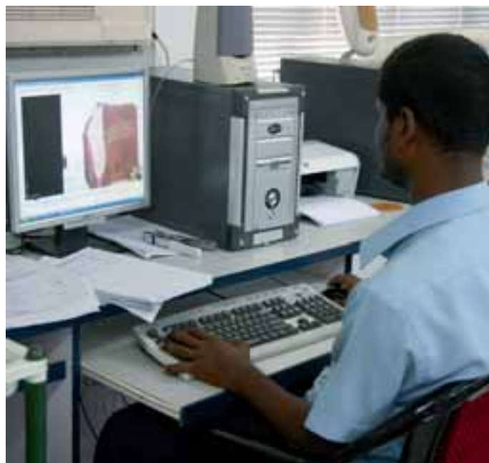
Computer Aided Design

Auch S. Muthurajan nimmt die chinesische Konkurrenz ernst. »Was unsere Infrastruktur betrifft, sind wir klar unterlegen – wir sind diesbezüglich auf dem Niveau, auf dem China 1995 war«, stellt er fest. Was die Lieferzeiten betrifft, sei Indien im Vorteil: vier Wochen von Indien nach Europa gegenüber sechs von China aus. Außerdem verfüge Indien über die schönsten Gesteinssorten für die Grabmalproduktion.