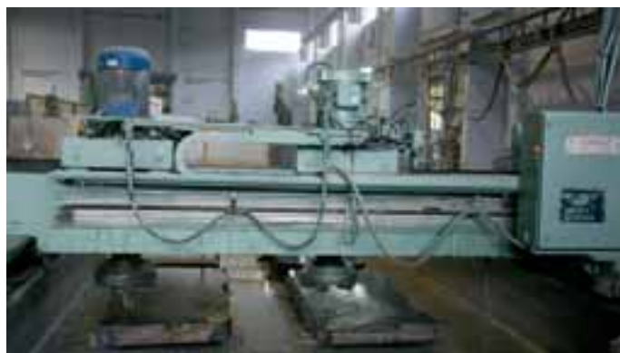
Flächenpolitur mit einer Anlage von Thibaut