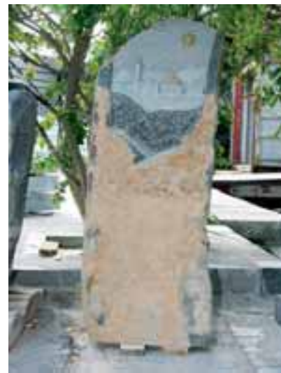
Handwerklich bearbeitetes Grabmal