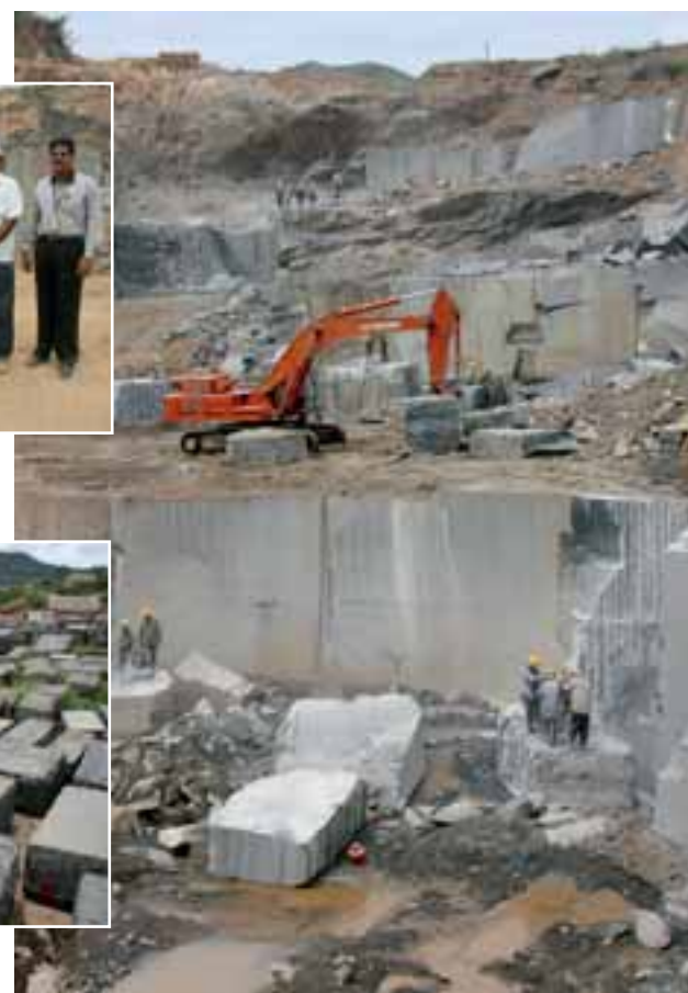
ABSOLUTE BLACK-Bruch der Firma GEM

tigware verkaufen, auch auf dem heimischen Markt. Sich noch mehr eigene Farben, sprich Brüche, zu sichern, auch im Ausland, gehört ebenfalls zu den Unternehmenszielen.