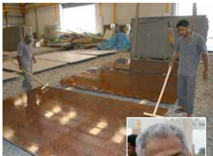
Bei Aro wird bislang noch maschinell UND per Hand resiniert.