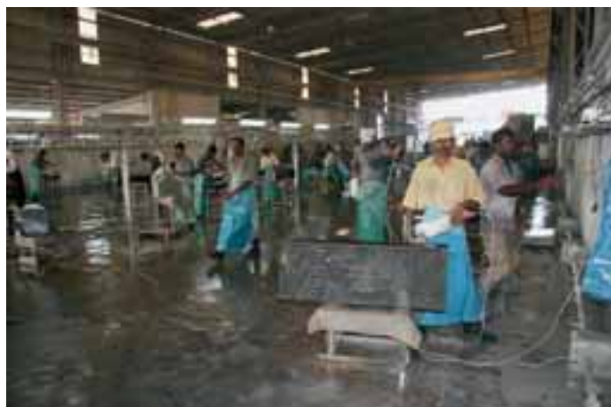
Schleifer bei GTP