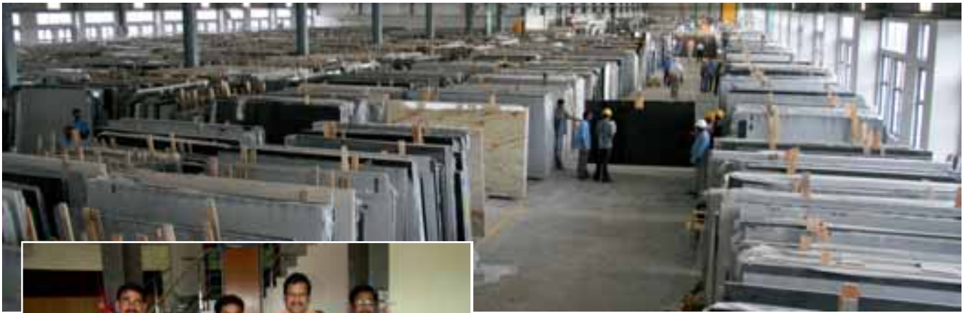
Unmaßplattenlager von Madhucon