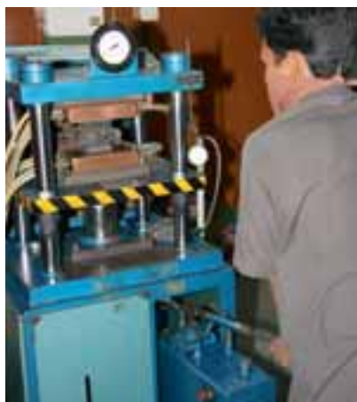
Segmente produziert GTP selbst