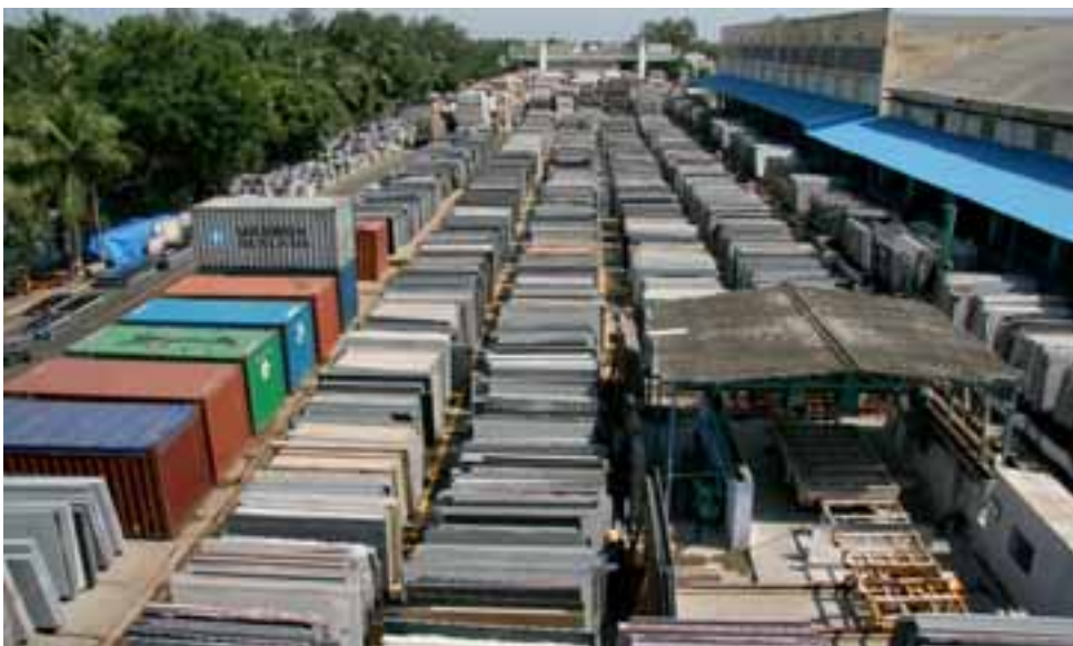
Block und Plattenlager der Firma GEM