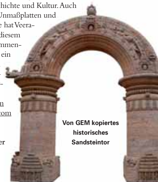
Von GEM kopiertes historisches Sandsteintor