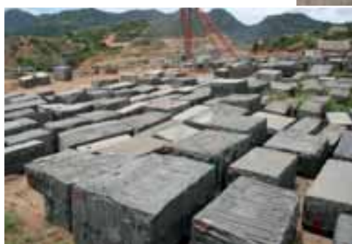
Blocklager am Bruch