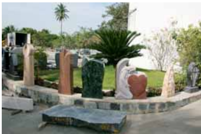
Grabmale von GTP