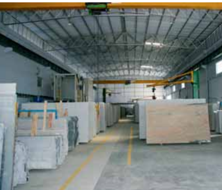
Unmaßplattenlager von Madurai Arkay