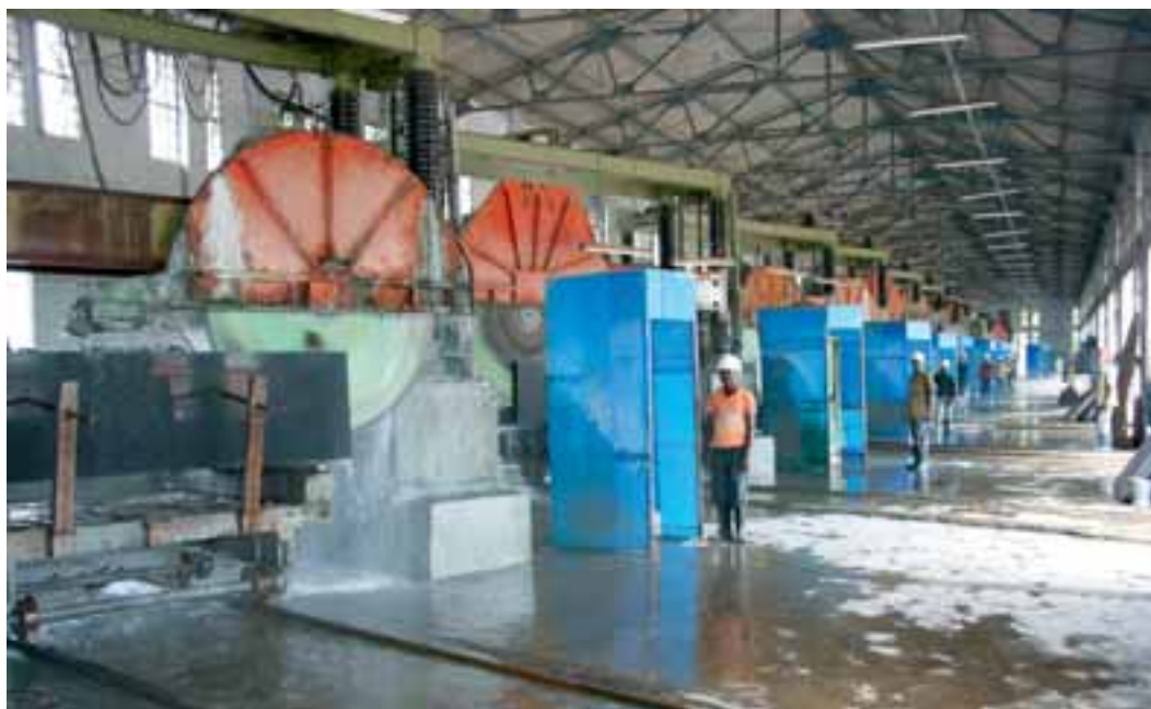
Blocksägen bei Enterprising Enterprises