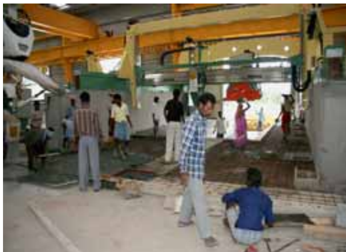
Aufbau neuer Tagliablocchi bei Aro. Frauen tragen Schalen mit Zement.