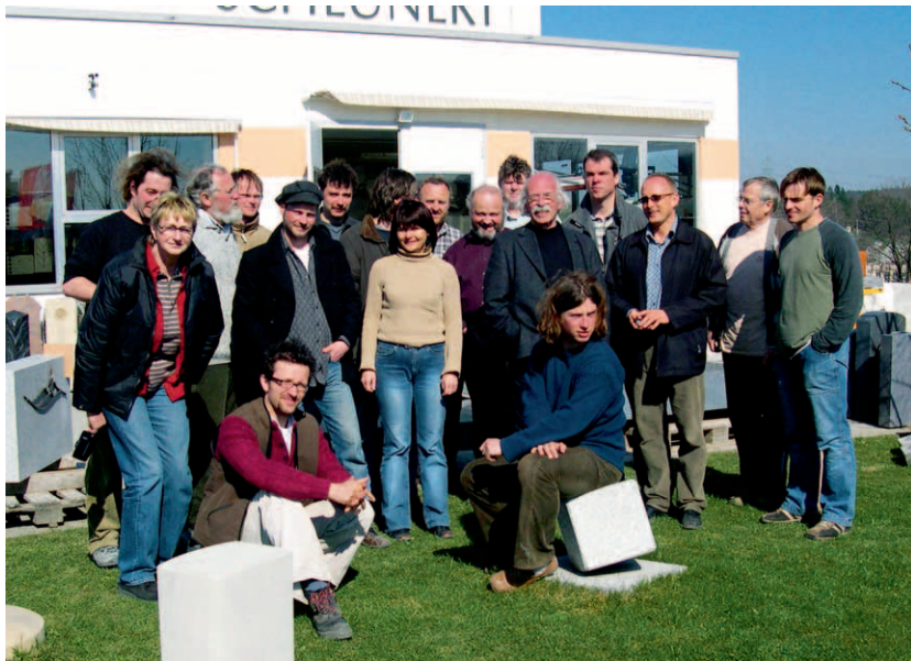
Engagiert für gute Grabmalgestaltung: die Mitglieder des Gestaltungskreises Ost