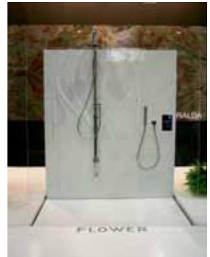
Dusche von Fratelli Testi