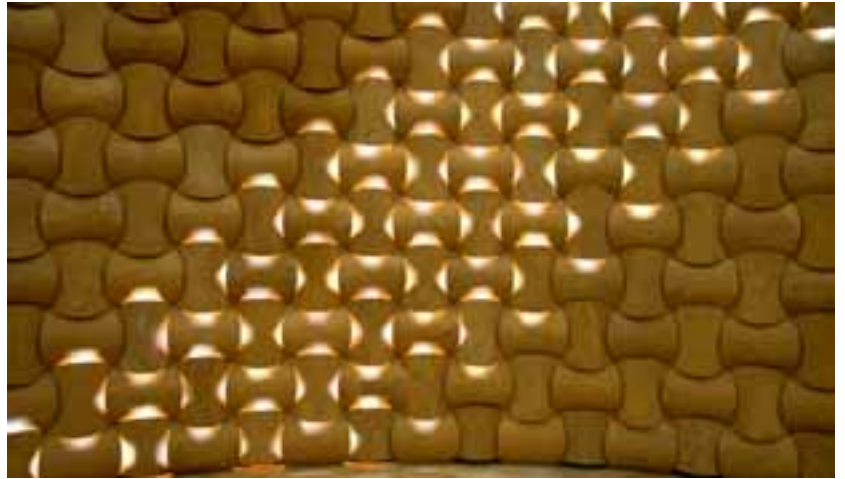
Eine Sandsteinwand der ungewöhnlichen Art hatte die Veroneser Firma Citco an ihrem Stand aufgebaut.

Stein, aus dem auch die Arena in Verona besteht. Die steinerne Wandkonstruktion setzt sich aus 20 bis 30 cm dicken und 600 bis 800 kg schweren Einzelstücken zusammen, zwischen denen extrem breite Fugen liegen. Stein sei von Natur aus schwergewichtig; Micheli habe bewusst steingerecht ge-