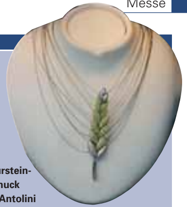
Naturstein-schmuck von Antolini

Antolini stellte auf der Messe seine neue »Diamond Collection« vor, in der man Naturwerkstein mit Kristallen von Swarovski verbunden hat. Im Rahmen einer Pressekonferenz erläuterten Francesco Antolini und seine Designer, was diese neue Kollektion in ihren Augen auszeichnet: Durch die Kristalle werde die natürliche Schönheit der Steine akzentuiert; die Verbindung von Natur- und Schmuckstein resultiere in besonderer Exklusivität. Seine neuen »Juwelen« präsentierte Antolini in einem von seinen Designern gestalteten