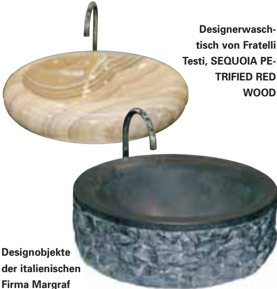
Designerwaschtisch von Fratelli Testi, SEQUOIA PETRIFIED RED WOOD