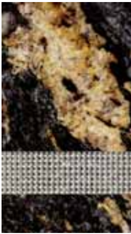
Granit BLACK COSMIC mit Swarovski-Kristall Black Diamond