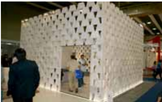
Michele de Lucchi baute für Piba Marmi offene Wände aus Marmortrapezen.