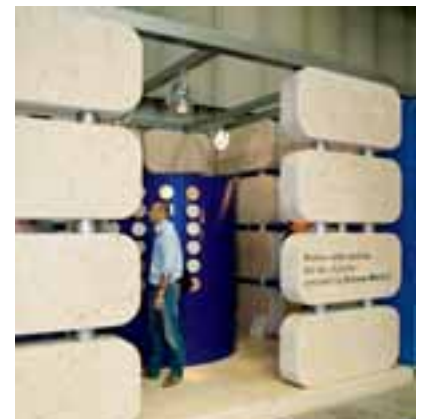
Monumentale Wandkonstruktion von Simone Michele für Pietra della Lessinia