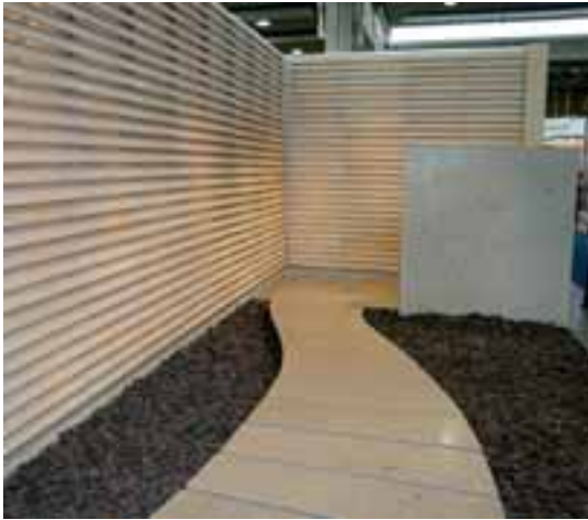
Aldo Cibics Arbeit für für Grassi Pietre.