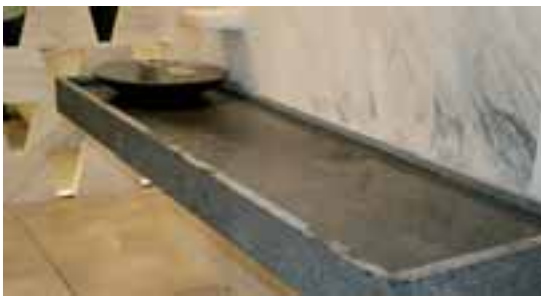
»Stein mag Wasser« nennt die japanische Designerin Hikoru Mori ihre Kreationen fürs Badezimmer.