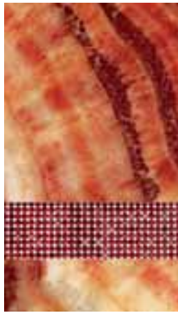
Onyx FANTASTICO V.C. mit Swarovski-Kristall Siam

Bei Antolini Luigi gehörten wie üblich Models, diesmal auf Schaukeln, zur Dekoration. Als Neuheit wurde die »Diamond Collection« präsentiert (siehe Kasten). www.antolini.it