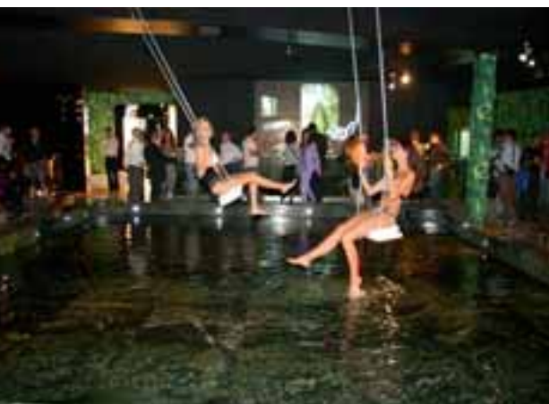
Schmuck auf Schaukeln