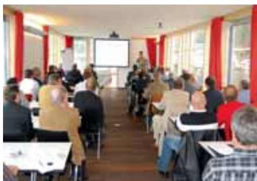
PNS-Tagung auf dem Zürichsee