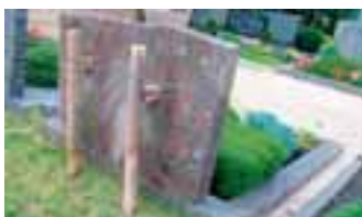
Mit Pfählen gesichert: Grabstein in Urberach

sind Fehler wie keine oder zu kurze Dübel zum Fundament, Klebungen, mangelhafter Haftverbund und schlechte Fundamentierung.