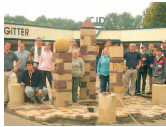
Gemeinsam schufen Menschen mit Behinderung und Steinmetzschüler aus Königslutter eine Brunnenanlage aus Sandstein.

Schüler und Beschäftigte überlegten sich im Vorfeld, welche Symbole diese drei Bereiche am besten verdeutlichen und setzten sie in Sandstein um. Im Rahmen ihrer Ausbildung leiteten die Schüler der Steinmetzschule die Beschäftigten der Werkstatt im Umgang mit dem Sandstein und den unterschiedlichen Werkzeugen an. Das Ergebnis kann sich sehen lassen. Im Eingangsbereich der Werkstätten ist eine professionell ge-