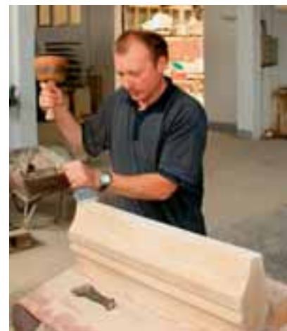
Blick in die Steinmetzwerkstatt