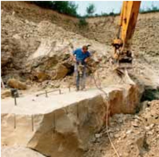
Abbau von BAUMBERGER KALKSANDSTEIN