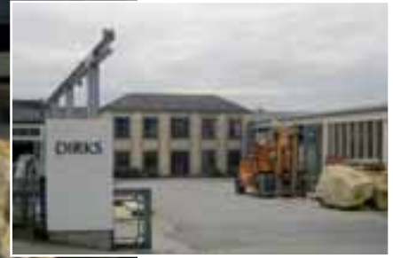
Blick auf das Firmengelände