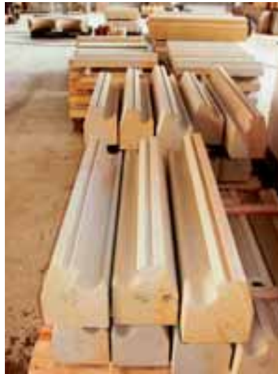
Profile aus BAUMBERGER