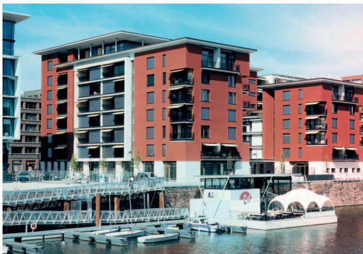
Beim Bau des »Cronstetten-Hauses«, einer Seniorenresidenz in Frankfurt am Main, wurde viel Travertin eingesetzt. Wir berichten ab Seite