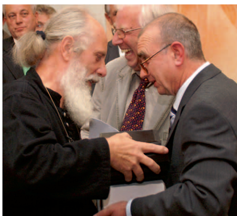
Auf der BUGA wurden die besten Mustergrabanlagen ausgezeichnet. Wegen eines Auftritts der Kanzlerin platzten die Friedhofskulturellen Tage, Bericht ab Seite