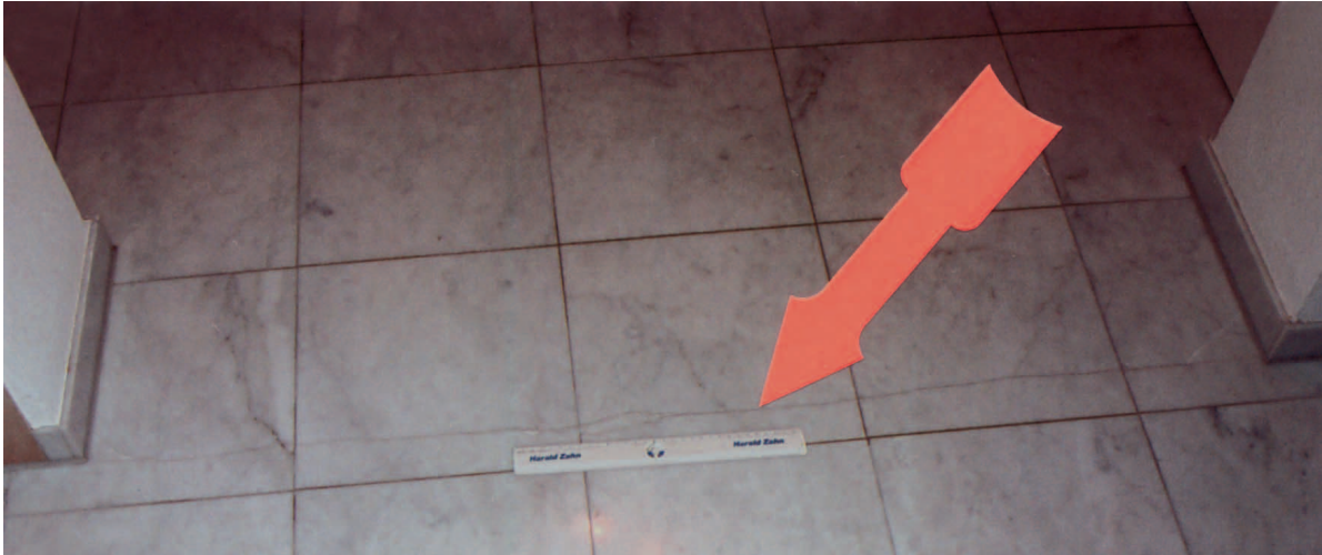
Riss durch fehlende Dehnfuge im Durchgang

war die Estricherstellung einwandfrei und für die Verlegung von Naturwerksteinbodenplatten gut geeignet.