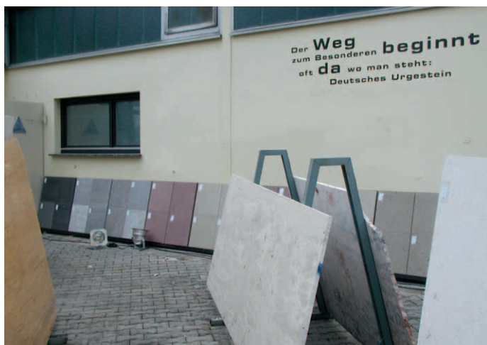
An der Wand der Produktionshalle ein deutliches Bekenntnis zum deutschen Naturstein