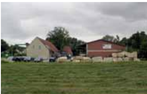
Werkhof der Firma Fark

nerationen ist das Unternehmen in Familienbesitz. Ein Wechsel an der Spitze steht bevor: In Kürze soll die achte Generation die Geschäftsleitung übernehmen.