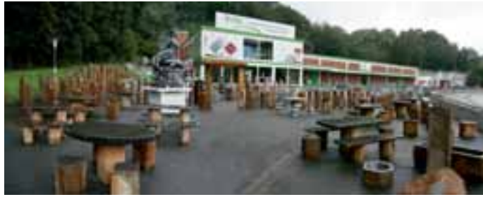
Das neue Kurz Naturstein-Zentrum in Bensheim