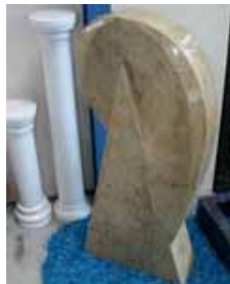
Modelle aus der Serie »Lithos Exklusiv«

STEIN BEARBEITUNG ist unsere Profession und das seit über 50 Jahren!