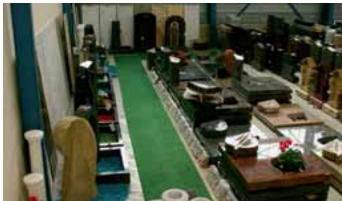
Grabmalausstellung bei Lithos Marmor