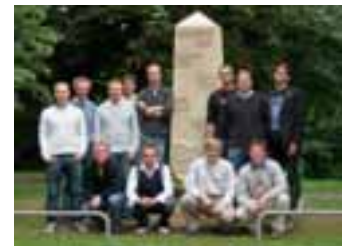
Die Techniker vor ihrem Obelisk

Die Technikerklasse an der Steinmetzschule Königslutter hat ein Denkmal für das 1000-jährige Bestehen der Gemeinde Veltumhof/Braunschweig geschaffen. In Zusammenarbeit mit einem örtlichen Steinmetzbetrieb ist ein Obelisk entstanden, der die Entwicklung des Ortes symbolisch widerspiegelt. In diesen haben die Schüler historische Bezeichnungen des Ortes in verschiedenen Schriftarten eingraviert: Die Bezeichnung Teletunnum aus dem Jahr 1007 wurde beispielsweise in romanischer Schrift ausgeführt und die Bezeich-