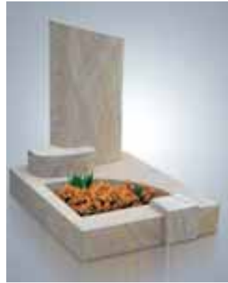
Urnengrabmal, allseitig geschliffen

Nord in Dielmissen im Weserbergland eröffnet (Ansprechpartner: Thomas Campe, Tel.: 01 75/934 94 62. Dort wird ständig eine große Auswahl an Spaltfelsen in Tauerngrün, Valverde, Atlantis, Basaltsäulen sowie anderen neuen Materialien geboten.