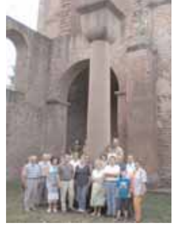
Die Tagungsteilnehmer vor der zur Bundestagung 1996 gefertigten Säule

Nach einem Vortrag über die Burg Limburg wurde das mittelalterliche Bauwerk besichtigt, auf dessen Gelände sich immer noch die 8 t schwere Säule mit Kapitell befindet, die zur Bundestagung 1996 im Rahmen eines Symposiums gefer-