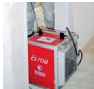
Der Luftreiniger Pullmann Ermator A 700

Der Luftreiniger Pullmann Ermator A 700 ist ein leichtes handliches Gerät für die Raumluftentstaubung. Mit den Abmessungen 42,0 cm x 40,5 cm x 47,0 cm hat es eine Eigenmasse von nur 14 kg. Durch die Anschlussleistung von 215 W werden in der Stunde 700 m 3 Luft angesaugt, in einem waschbaren Grobfilter (90 PPI) und einem HEPA 13 Feinstaubfilter gereinigt und wieder abgegeben. Wird der Ermator A 700 in die Tür gestellt, saugt er die verschmutzte Raumluft an und die gereinigte Luft strömt über dem Gerät wieder zurück in den Arbeitsraum. Bei Innenarbeiten bleiben die Nebenräume staubfrei.