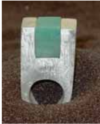
»Remember-Ring« von Schmelter & Heine

Am 8. und 9. September hat die DESTAG ihr neues Lager