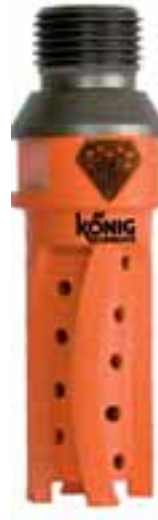
Der neue Hochgeschwindigkeits-Fingerfräser von ADI

J.König GmbH & Co Dieselstraße 2 76227 Karlsruhe Tel.: 07 21/4 09 05-0 info@j-koenig.de www.j-koenig.de