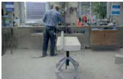
Steinmetzwerkstatt der Wilhelm Fark GmbH