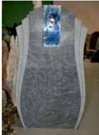
Grabmal mit Glaselement

Im neuen Kurz Naturstein-Zentrum bietet die Firma ihren Kunden eine große und vielfältige Ausstellung: Felsen und Basaltsäulen im Außenbereich sowie Grabmaldesign und Garten-